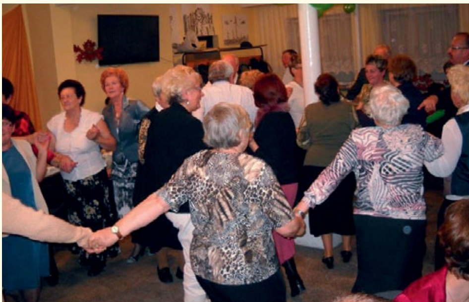
W Świetlicy wiejskiej w Kczewie 9 listopada bawili się seniorzy z Bzowa i Kczewa