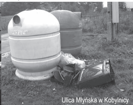
Ulica Młyńska w Kobylnicy

Takie widoki jak te na zdjęciach nadal możemy obserwować we wszystkich miejscowościach w Gminie. Licząc na to, że po publikacji zdjęć dzikie składowiska śmieci znikną i się nie odrodzą, zachęcamy Państwa do przesyłania fotografii najbardziej, Państwa zdaniem, zaśmieconych miejsc naszej Gminy.