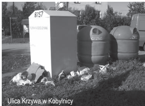
Ulica Krzywa w Kobylnicy

miejsowościach w Gminie. Właściciele posesji korzystają z nich bezpłatnie. Opróżnia się je raz w miesiącu, a jeżeli zachodzi konieczność to i częściej. Za gminne pieniądze sprzątane są i remontowane przystanki autobusowe, na których niestety swoje frustracje wyładowuje okoliczna młodzież dewastując je i niszcząc. Gmina dba też o porządki w miejscowościach sprzątając chodniki, place i ulice. Na koszt Gminy likwidowane i zamykane są dzikie wysypiska. Tylko w ubiegłym roku na sprzątanie i usuwanie śmieci i odpadów Gmina wydała ponad 100 000 złotych. Niesegregowane śmieci podrzucają się w miejscach w ogóle do tego nieprzeznaczonych. Ludzie nie segregują odpadów, a worki ze śmieciami podrzucają często przy pojemnikach na szkło lub plastik. Straż Gminna zapowiada jednak bezwzględne kontrole i kary dla tych, którzy zaśmiecają Gminę.