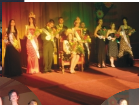
I wszystko jasne