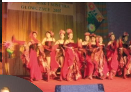
Kankan w wykonaniu Arabesek