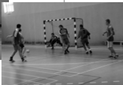
Mecz o I miejsce Wrząca-Sycewice

doszło do niespodzianki. Sołectwo Wrząca pokonało zdecydowanie gminę Kobylnica 4:1. W 2 półfinale faworyzowane Sycewice, po małych problemach na początku meczu, zwyciężyły Słonowice 3:1. W meczu o 3 miejsce gmina Kobylnica uległa Słonowicom 1:3, a w wielkim finale wyższość Sycewic w każdej minucie gry z Wrzącą nie podlegała najmniejszej wątpliwo-