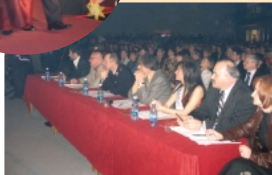
Jury z uwagą obserwowało przebieg konkursu