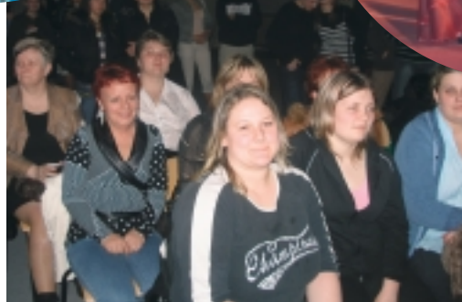
Silna grupa z Wrzącej dzielnie wspierała swoją faworytkę