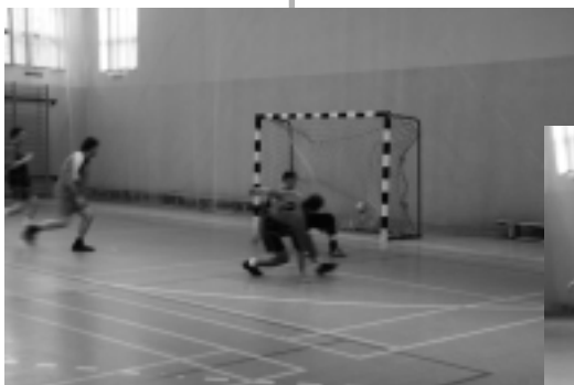
Bramkę zdobywa król strzelców Tomasz Chałubiński

problemów wywalczyły Sycewice z imponującym stosunkiem bramkowym 15:2. Okazało się, że stawkę półfinalistów, czyli zwycięzców poszczególnych grup uzupełniła drużyna Wrzącej. W meczach półfinałowych