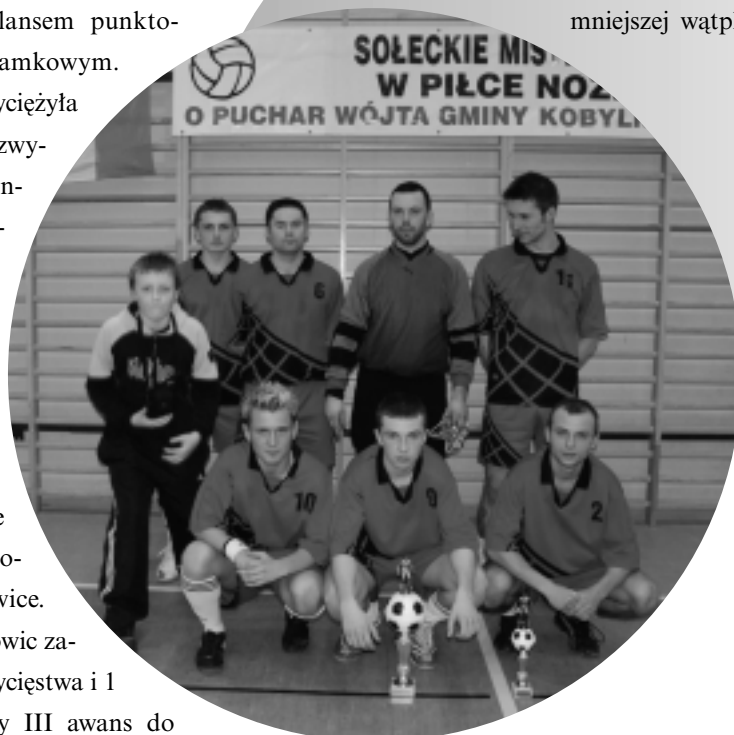
Zwycięska drużyna sołectwa Sycewice