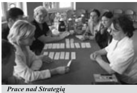
Prace nad Strategią

10 czerwca w Zespole Szkół Samorządowych w Kobylnicy odbyła się II debata w sprawie aktualizacji Strategii Rozwoju Społeczno – Gospodarczego Gminy Kobylnica. Pierwsze spotkanie odbyło się 20 maja. Debata nad aktualizacją Strategii prowadziła firma konsultingowa Business Mobility International. W spotkaniach brał udział m.in.: pracownicy Urzędu Gminy i jednostek organizacyjnych (OPS, szko-