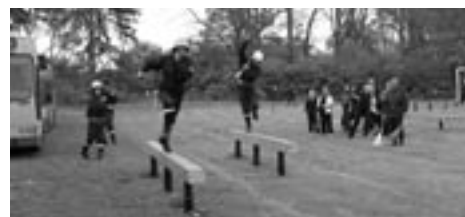
Biegi sztafetowe wymagają dużej kondycji