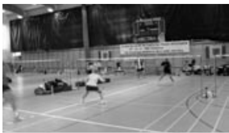
Zawodnicy wkładali w grę maksimum ambicji i umiejętności

KOBYLNICZA. Gmina Kobylnica życzliwie nastawiona do organizacji imprez sportowych i turystycznych najwyższej rangi, tym razem gościła najlepszych polskich badmintonistów weteranów. Areną dwudniowych zmagani mistrzów popularnej komетки była hala sportowa w Kobylnicy. W 26 Indywidualnych Mistrzostwach Polski Weteranów wzięło ostatecznie udział 110 zawodników