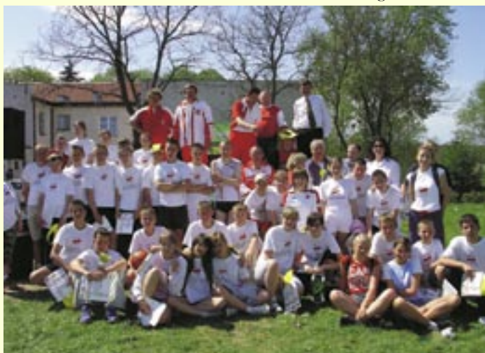
Grupa młodych sportowców z Racotu prezentowała się nadzwyczaj efektywnie.

„KURIER SOŁECKI” Miesięcznik Stowarzyszenia Sołtysów Gminy Kobylnica. Zespół redakcyjny: Zbigniew Podolak, Patrycja Adamiec, Halina Święch, Grażyna Hanulak. Redaktor odpowiedzialny: Józef Broda. Adres redakcji: Urząd Gminy, ul. Główna 20, 76-251 Kobylnica, tel. (059) 842 96 17, fax. (059) 842 90 70 ~ 72. Redakcja nie odpowiada za treść ogłoszeń i listów; zastrzega sobie prawo dokonywania skrótów w tekstach. Druk: Zakład Poligraficzny „GRAWIPOL” w Słupsku, ul. Poznańska 42, tel. (059) 848 54 30, fax. (059) 842 65 56, e-mail: grawipol@grawipol.pl