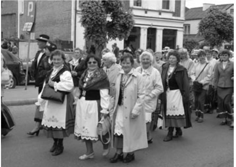
I „RUCZAJ” tam też był.