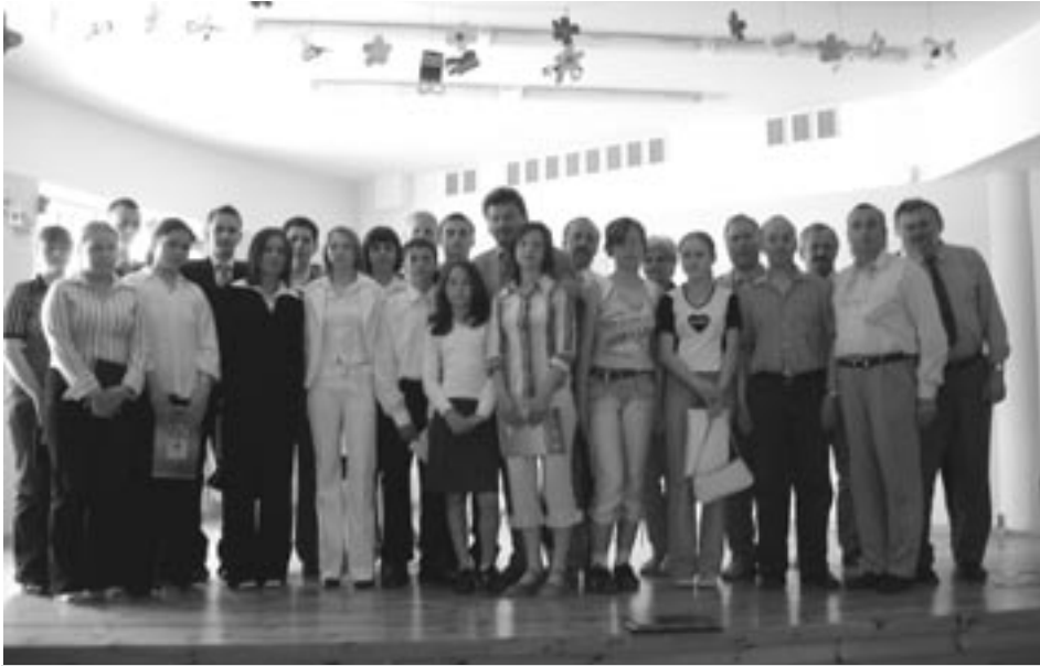
Młodzieżowa Rada Gminy wraz z Radnymi Gminy Kobylnica

Piętnastoosobowa grupa młodych mieszkańców naszej gminy, ze szkół podstawowych, gimnazjalnych i ponadgimnazjalnych, została wyłoniona na drodze wyborów powszechnych, które odbyły się 28 kwietnia do Młodzieżowej Rady Gminy Kobylnica.