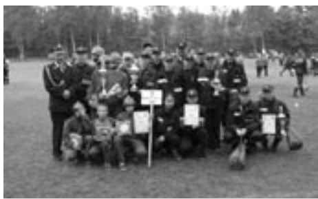
Reprezentacja Gminy Kobylnica