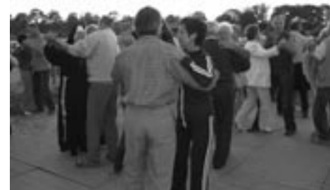
..... i dorośli