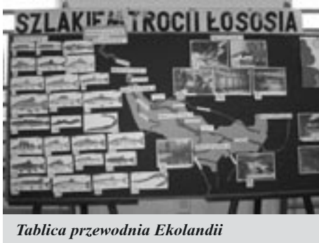
Tablica przewodnia Ekolandii