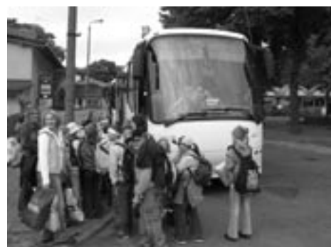
Wracamy do Działisza

cu wrześniu do Kościeliska na podobnych zasadach jak uczestniczyły dzieci z zaprzyjaźnionej gminy. (red.)