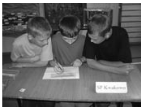
Uczniowie z Kwakowa w pocie czoła rozwiązuja kolejny test

KOŃCZEWO. Światowy Dzień Ochrony Środowiska, Gminny Ośrodek Kultury w Kobylnicy wspólnie ze Szkołą Podstawową w Kończewie , podkreślił organizując „Ekolandię”, czyli Gminny Konkurs Ekologiczny. W tym roku, podobnie zresztą jak w pięciu poprzednich edycjach, uczestnicy musieli wykazać się gruntowną wiedzą o troci, łososiu i innych rybach żyjących w rzekach Parku Krajobrazowego „Dolina Słupi” . Uczniowie szkół podstawowych odpowiadali na pytania oraz rozwiązywali testy i krzyżówki. O wysoki poziom pytań i zadań testowych, w opinii niektórych opiekunów