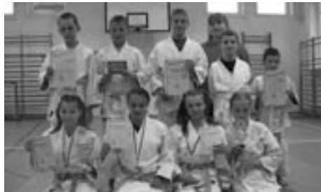
Najlepsze zawodniczki i zawodnicy UKS „Orzeł” Kończewo z medalowymi trofeami

wszystkich ekip biorących udział w zawodach wybrali 8 najlepszych zawodników i 4 najlepsze zawodniczki ligi. W tym doborowym towarzystwie znalazło się rodzeństwo Magdy