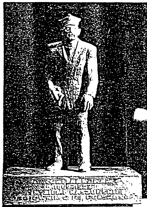
Taki pomnik Antoniego Abrahama stanie w ciągu dwóch lat na Placu Kaszubskim w Gdyni - I nagroda

Konkurs sponsorowany był przez Urząd Miasta Gdyni.