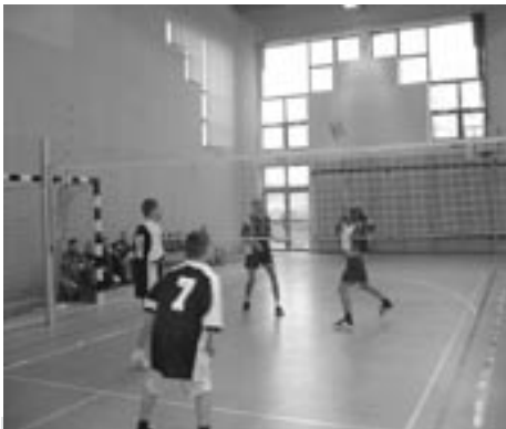
W akcji zawodnicy reprezentujący szkoły w Kwakowie i Kończewie