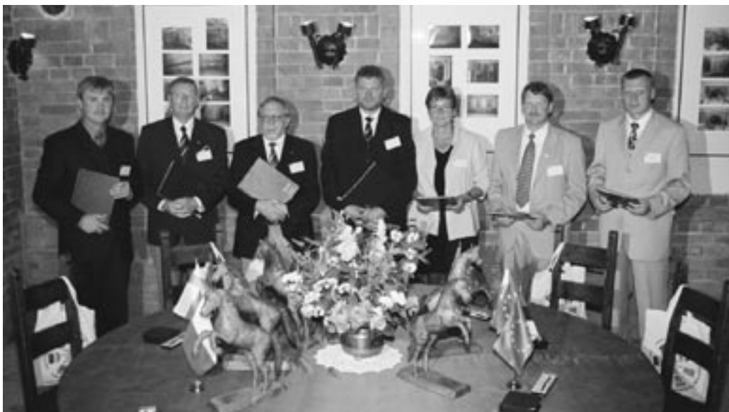
Prezydenci i wójtowie zaprzyjaźnionych miast i gmin po podpisaniu porozumienia o współpracy 2 lipca 2004 r

Styczeń 2002r. - spotkanie w Durbuy - Belgia, podczas którego uczestnicy seminarium, w tym delegacja z Kobylnicy, debatują nad terroryzmem w świetle wydarzeń 11 września.