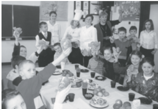
Uczniowie i pracownicy Szkoły Podstawowej w Kwakowie otrzymali pyszne pączki dzięki uprzejmości Firmy gastronomicznej „Maja”