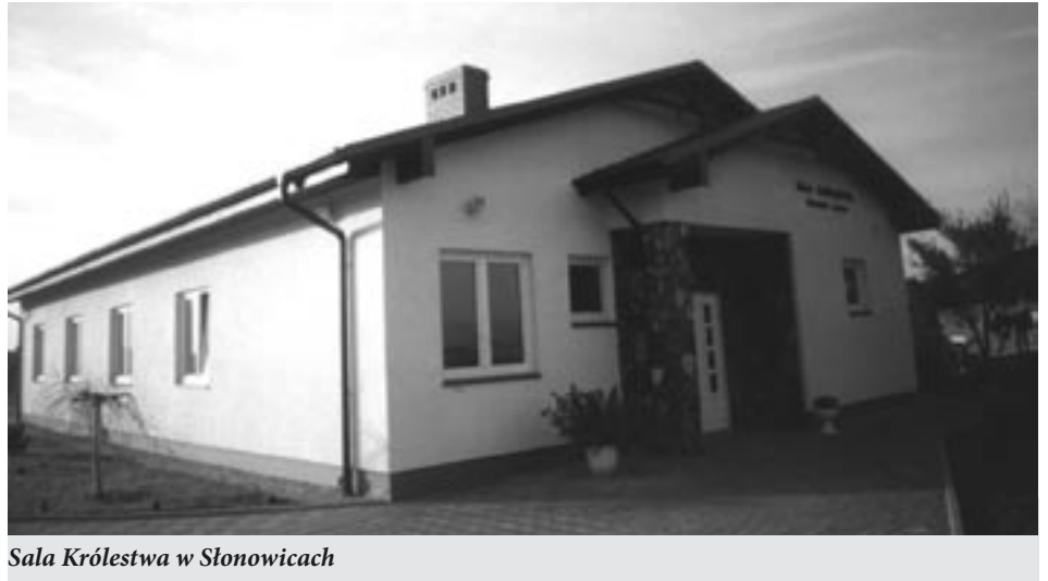
Sala Królestwa w Słonowicach