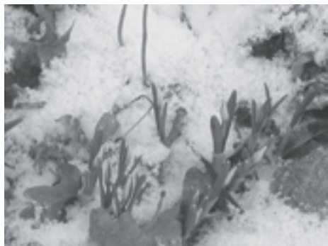
Zwiastun wiosny fot. 26.01.2005 r