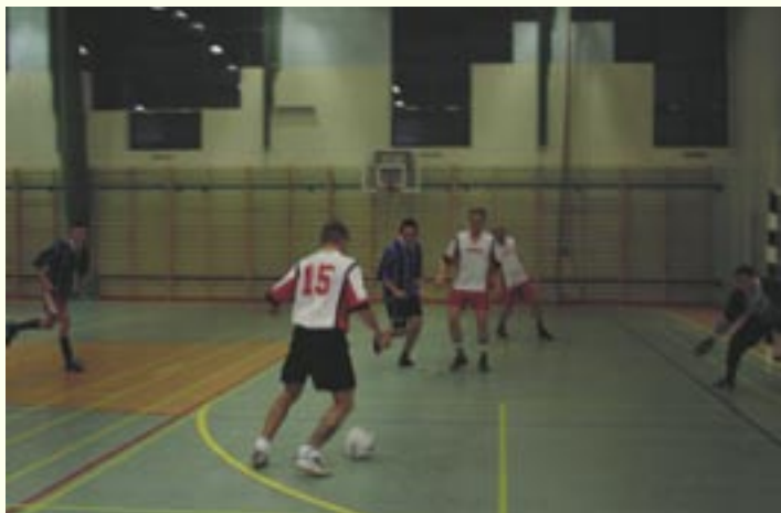
Piłkarze Sycewic (w białych koszulkach) w natarciu na bramkę Sierakowa.

Rozgrywki halowe w piłce nożnej w gminie Kobylnica tradycyjnie kończą Mistrzostwa Sołectw. W tegorocznej edycji wzięły udział reprezentacje 13 sołectw. Podzielone zostały one na 3 grupy. W pierwszej liczącej 5 zespołów drużyny grały 2 x 8 min. Niespodziewanie, acz zasłużenie, z tej rywalizacji zwycięsko wyszła, z kompletem czterech wygranych, reprezentacja sołectwa Sierakowo . Wyprzedziła ona kolejno: Słonowice , Bolesławice , Reblino i Kruszyń . W grupie drugiej mecze odbywały się 2 x 9 min. Według