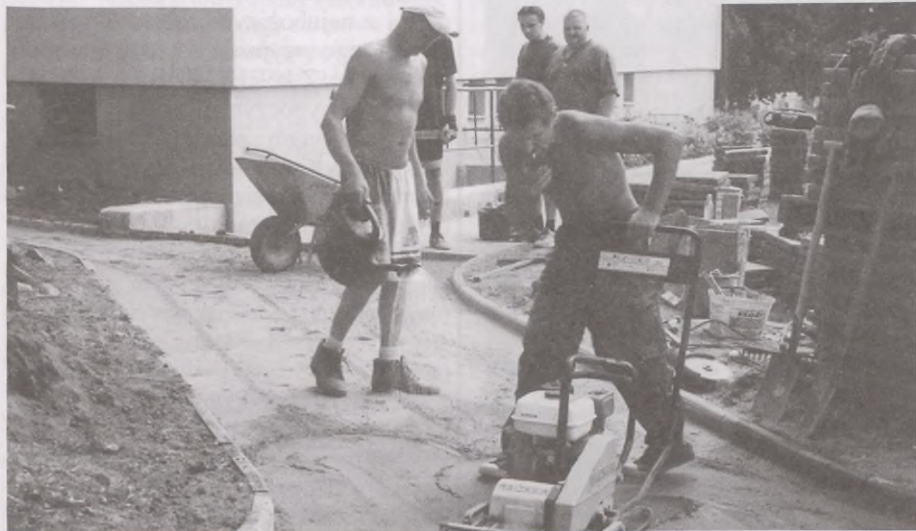
Budowa dojść do placu zabaw w Sycewicach

Dzięki Odnowie Wsi Pomorskiej następuje integracja lokalnej społeczności. Wioski są zadbane, przybywa też obiektów sportowych i miejsc do zabawy. Może też ożywią się i inne sołectwa?