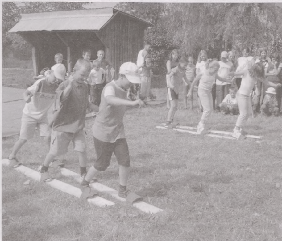
Zespołowy bieg na nartach