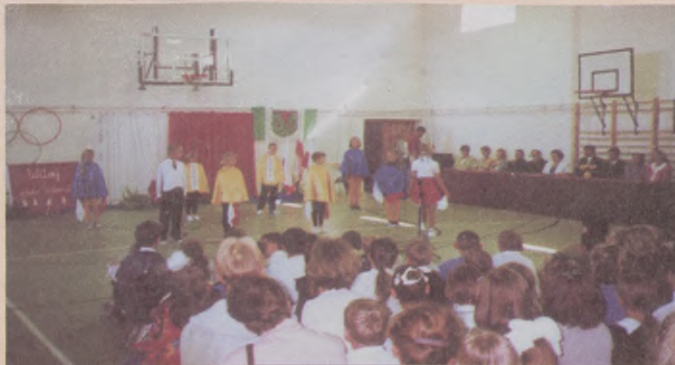
Inauguracja roku szkolnego w Kawakowie