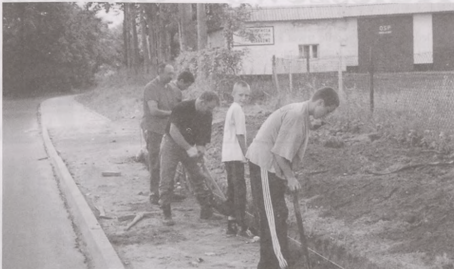
Prace przy układaniu chodnika w Sierakowie

Kończą się prace w Luleminie przy budowie placu zabaw dla dzieci z boiskiem wielofunkcyjnym. Będzie wiata z rusztem, stoliki i ławki oraz wydzielone miejsce na parking. Całość estetycznie ogrodzona. Wartość przedsięwzięcia 47.308, udział własny mieszkańców i partnerów w kwocie 10.082 zł. Pomagają wszyscy nie tylko z naszej wioski. Tartak w Widzinie przetarł nam drewno na