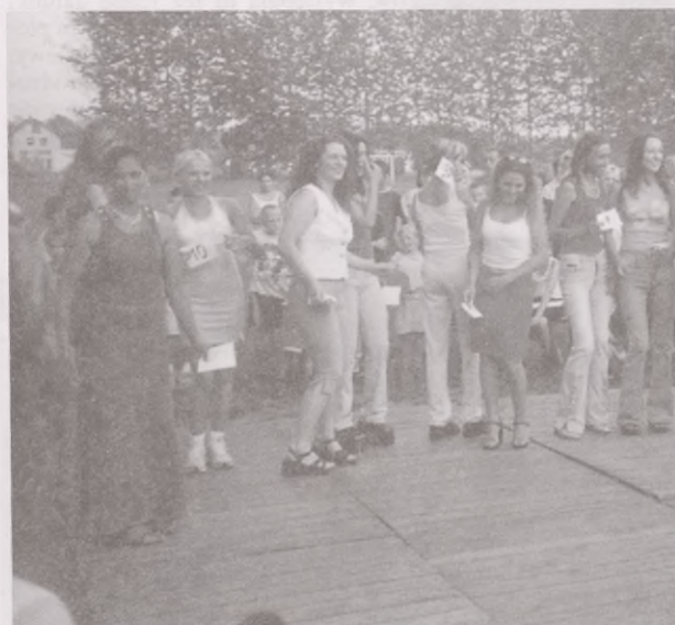
Trwa konkurs na najpiękniejszą dziewczynę lata, obok trzy najładniejsze dziewczyny lata ze wspaniałymi nagrodami