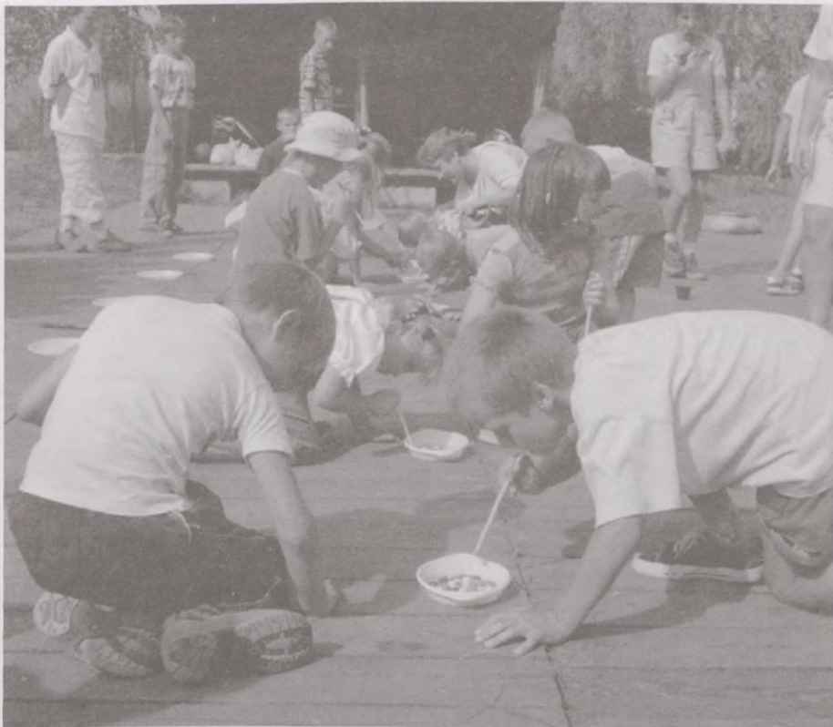
Wyszysanie drażetek nie było łatwe