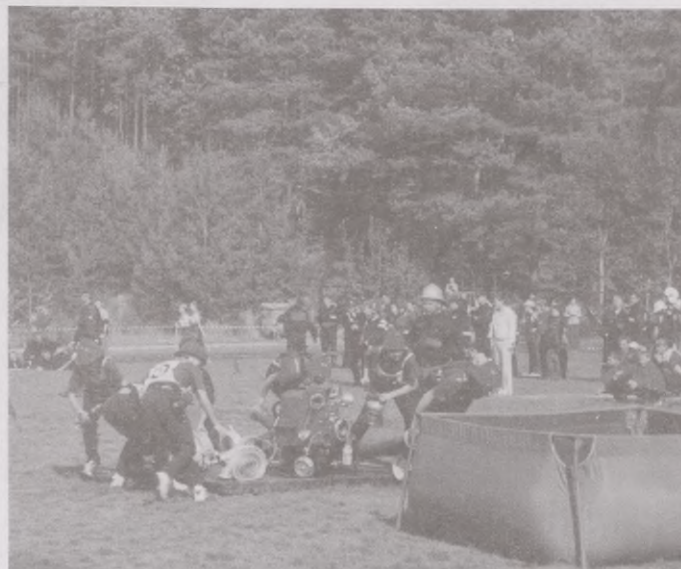
Ochotniczki i ochotnicy prezentowali się doskonale