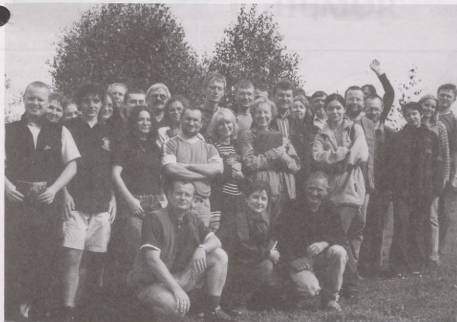
Uczestnicy sesji wyjazdowej