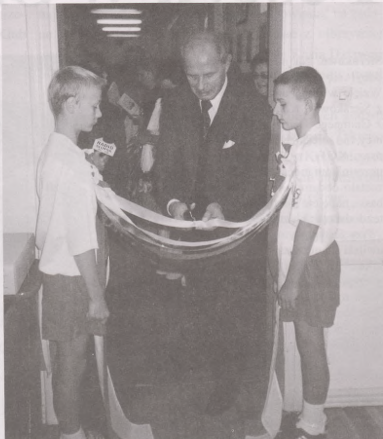
Pierwszą wstęgę przeciął Jerzy Wysokiński Minister Kancelarii Prezydenta RP