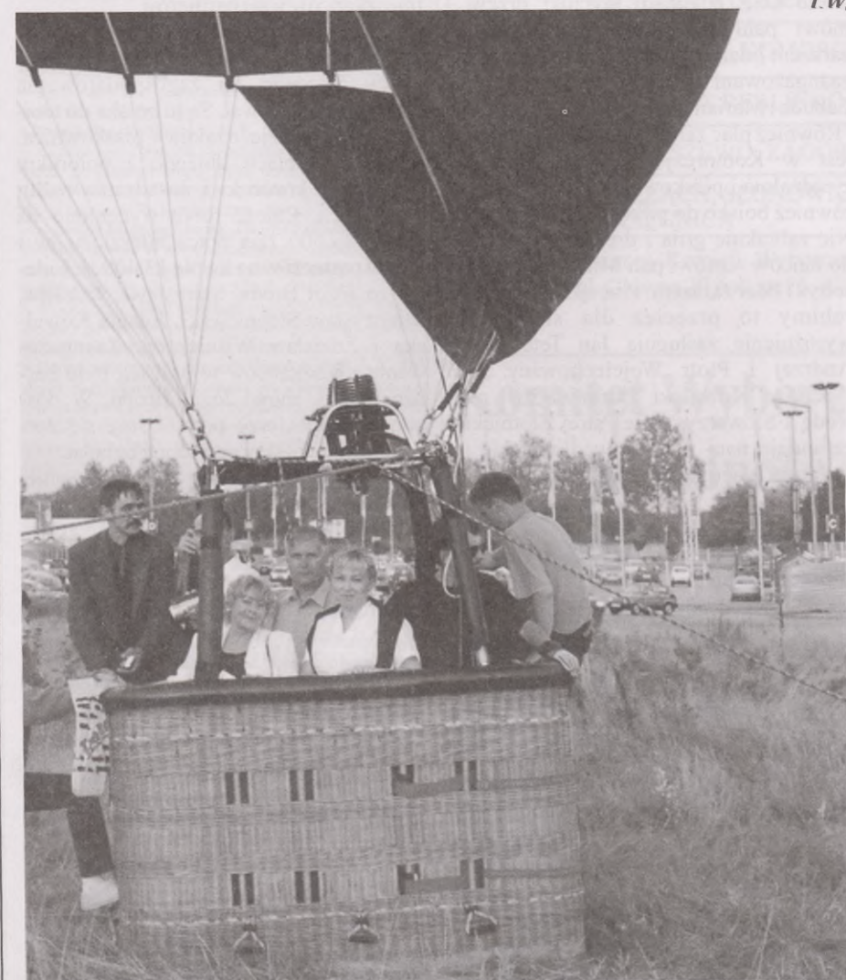
Tuż przed startem