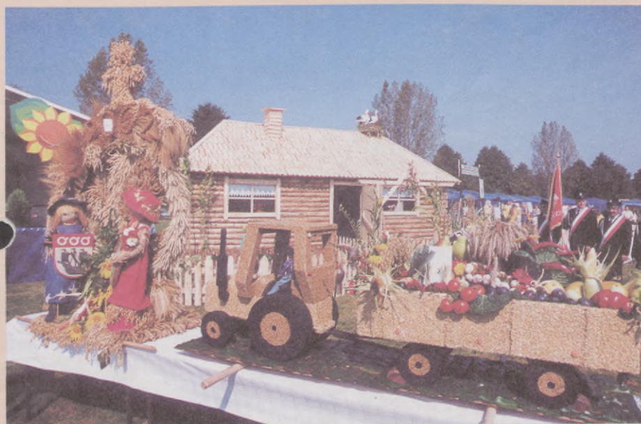
Efektowny wieniec z Łocina nagrodzony I miejscem O dożynkach piszemy na str. 16