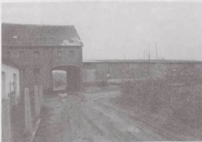
Zespół folwarczny w Bzowie