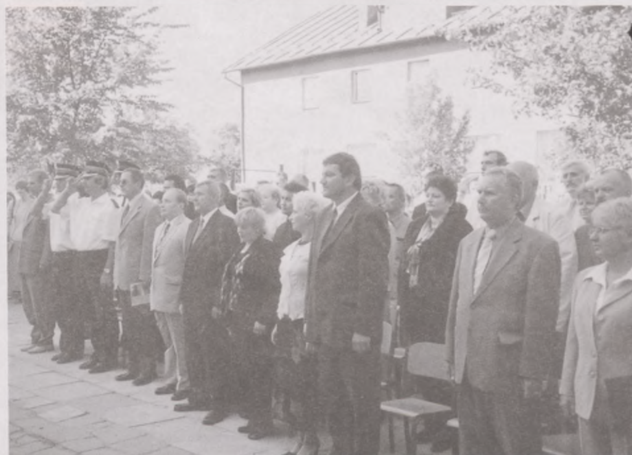
Honorowi goście na szkolnym dziedzińcu