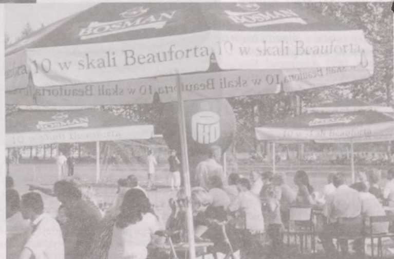
Pogoda dopisała, można było odpocząć przy piwku i kiełbasce