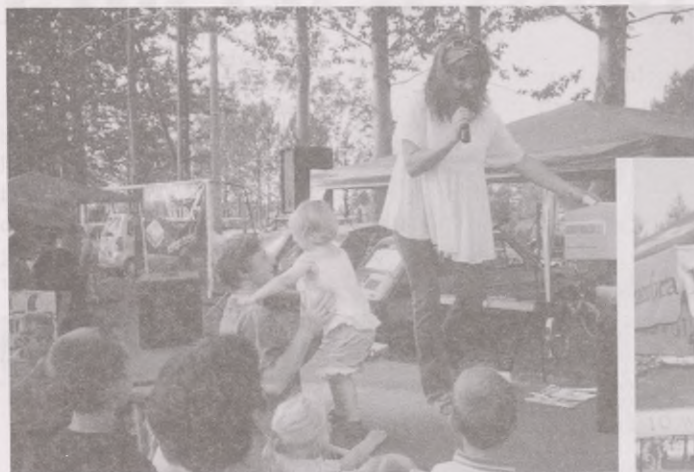
Za chwilę odbędzie się losowanie kosiarki przez uroczą dziewczynkę