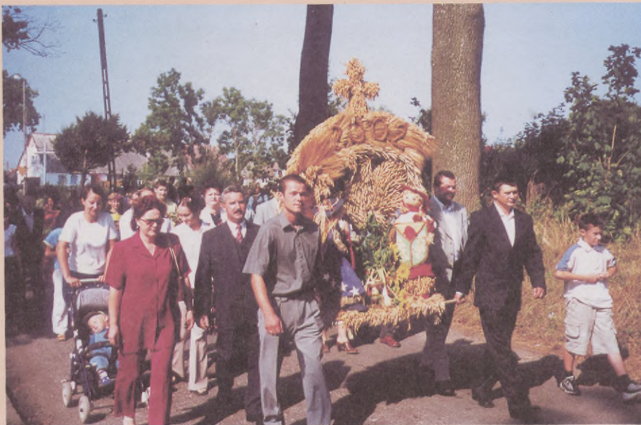
Barwny korowód dożynkowy