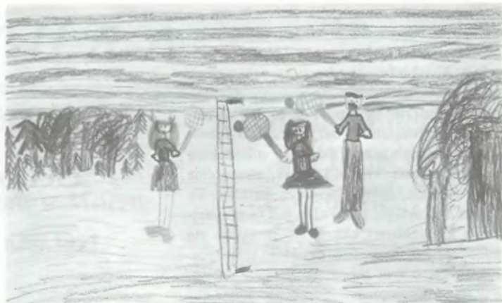
Korty tenisowe w wejherowie Emilia

Z myślą głównie o dzieciach i młodzieży miasto zwiększa wydatki na sport i rekreację. Mimo że nie jest to naszym obowiązkiem, praktycznie w całości przejęliśmy utrzymanie Miejskiego Ośrodka Sportu, dotychczas finansowanego przez kuratorium, dzięki czemu „coś” ruszyło się wreszcie w sporcie szkolnym. Dzięki pomocy Elektrowni Szczytowo — Pompowej, za którą tą drogą bardzo serdecznie dziękuję, jeszcze w tym roku rozbudowana zostanie na terenie Szkoły Podstawowej Nr 8 baza dla MOS-u. Powstanie tam ośrodek sportu szkolnego z prawdziwego zdarzenia. Prawie w całości miasto przejęło finansowanie „Gryfu”, jedynego wejherowskiego klubu sportowego. Z finansowania klubu praktycznie wycofały się związki sportowe i Urząd Wojewódzki. Zdecydowana większość jego zawodników to dzieci i młodzież z Wejherowa.