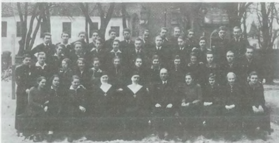
Uczestnicy kursu tańca męskiego i żeńskiego gimnazjum na podwórku szkolnym (w tle widać Kościół Św. Anny). Siostrę Alicję w środku, ponad nią autorka wspomnień.

(ciąg dalszy wspomnień w następnym numerze)