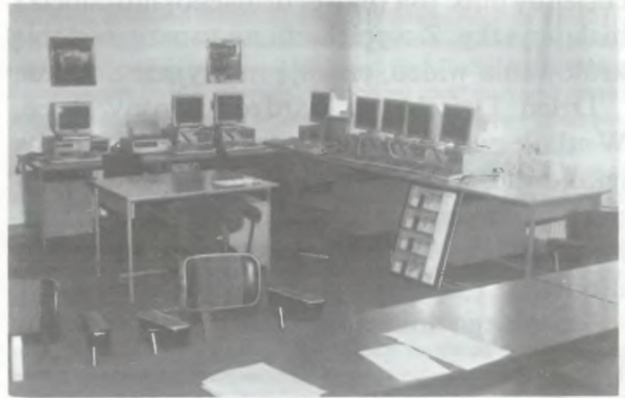
Pracownia komputerowa w „elektryku”

W ramach rewizyty do Varberg 21 kwietnia udała się 4-osobowa delegacja nauczycieli z ZSE. Tam podpisano porozumienia między szkołami i ustalono warunki wymiany. Pierwsza grupa uczniów z technikum wyjeżdża do Szwecji w czasie wakacji. Nauczyciele i uczniowie będą mieli możliwość korzystania ze sprzętu szkoły.