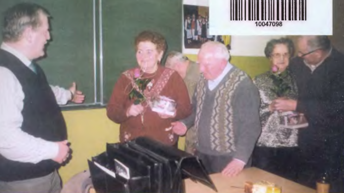
Z życia towarzyskiego. Spotkanie z seniorami Zespołu.