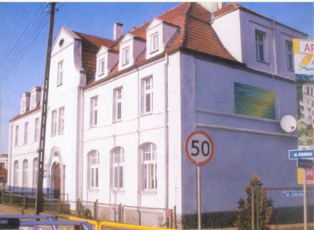
Siedziba Zasadniczej Szkoły Zawodowej w Redzie, gdzie odbywają się próby Zespołu.