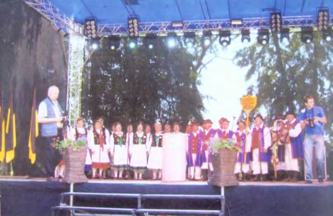
Na zjazdowej scenie. Bytów 2009 r.