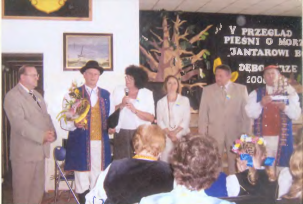
Wręczenie I nagrody na V Przeglądzie Pieśni o Morzu „Jantarowi Bôt”. Dębogórze 2006 r.