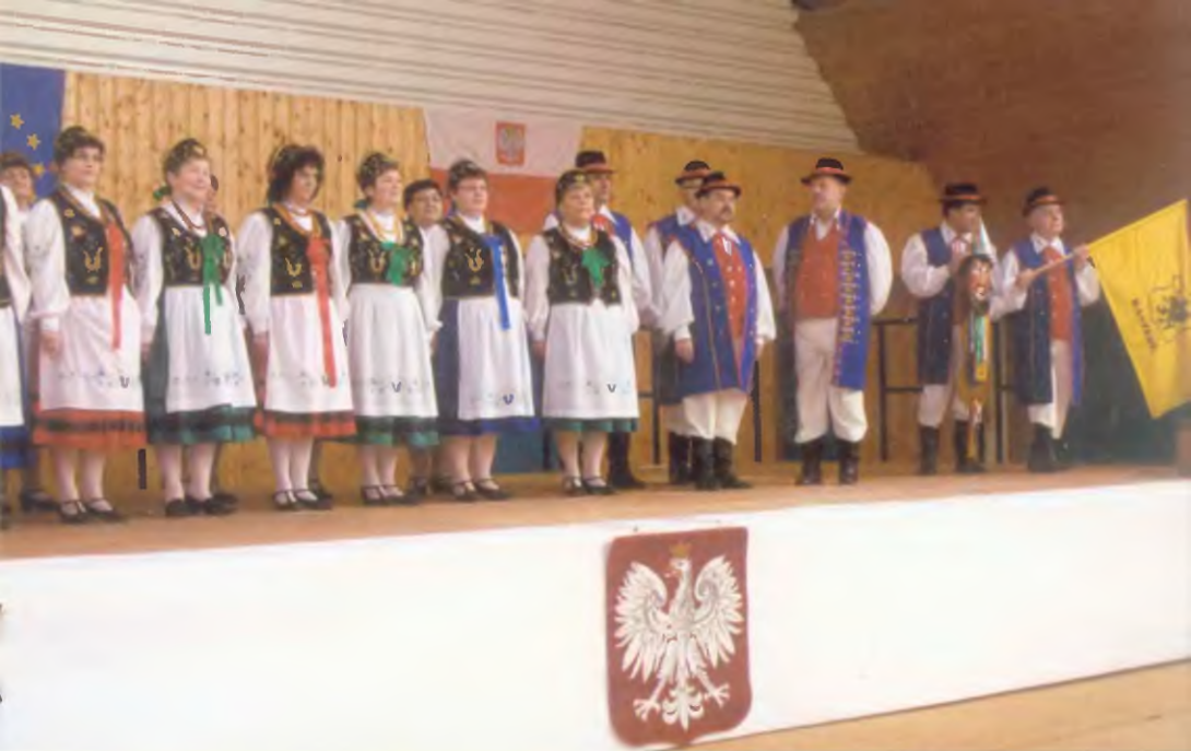
Koncert w trakcie wyjazdu do Francji w 2008 r.