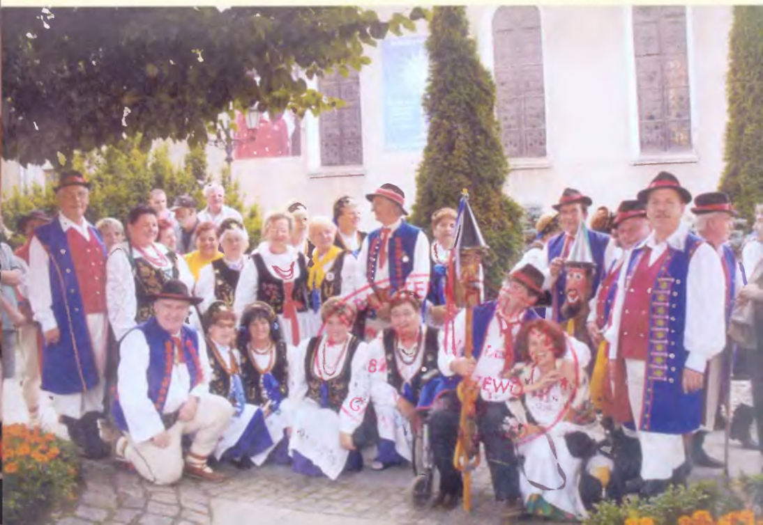
Na spotkaniu kaszubsko - góralskim w Wejherowie w 2007 r.