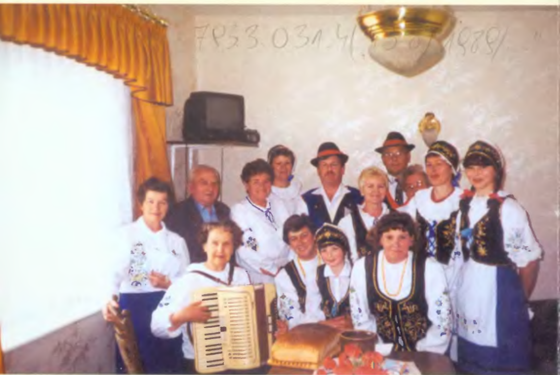
Po pierwszym koncercie.