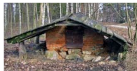
PIEC CHLEBOWY W CZERNICY