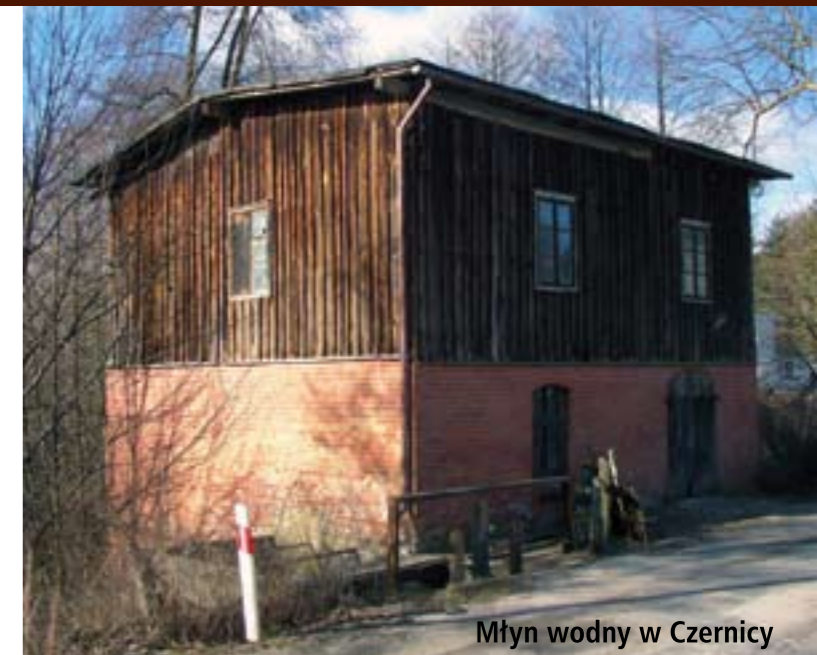
Młyn wodny w Czernicy

Powolny proces zanikania rodzimych tradycji budowlanych następował na terenach wchodzących obecnie w skład ZPK pod wpływem kolonizacji pruskiej z końca XVIII w. i niemieckiej w drugiej połowie XIX w. Władze wprowadzały zarządzenia mające na celu ograniczenie używania drewna jako budulca. Lasy zostały przejęte przez rząd pruski i objęte szeregiem zarządzeń ochronnych ograniczających ich eksploatację. O rozwoju budownictwa decydowały również urzędowe zarządzenia pruskie wprowadzające nowe zasady.