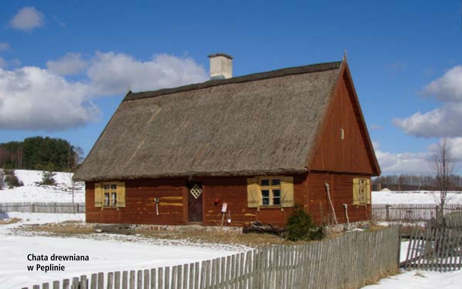
Chata drewniana w Peplinie