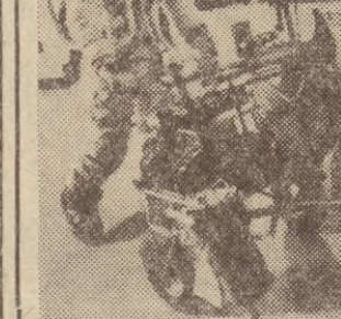
„Nachodka“ zdawana jest na 5 dni przed planowanym terminem.