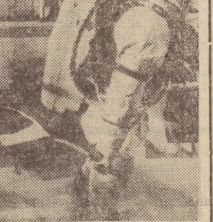
Poprawia się stan zdrowia ofiar poniedziałkowej katastrofy

Wczoraj odwiedzili w szpitalu ofiary katastrofy przedstawiciele DOKP.