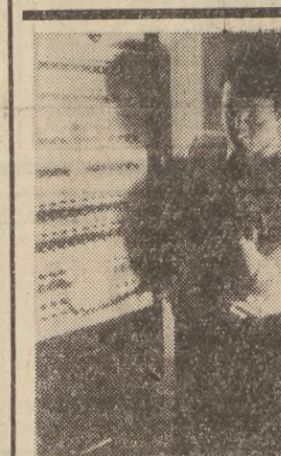
Na zdjęciu: w ośrodku telefetu amerykańskiej agencji prasowej UPI przekazującym zdjęcia z całego świata do ośrodków w Europie (m. in. do CAF w Warszawie) trzeba było uruchomić przenośne generatory, aby nie spowodować przerw w transmisji aktualnych zdjęć.

MEKSYK (PAP). Ambasada szwajcarska w Rio de Janeiro otrzymała we środę pisany ręcznie list od uprowadzonego ambasadora Szwajcarii w Brzylizji Buchera. Świadczy on że czuje się dobrze. List — pierwszy jaki otrzymano od Buchera — znalazł się w ręku wstąpienia w przedmiejscu Rio de Janeiro.