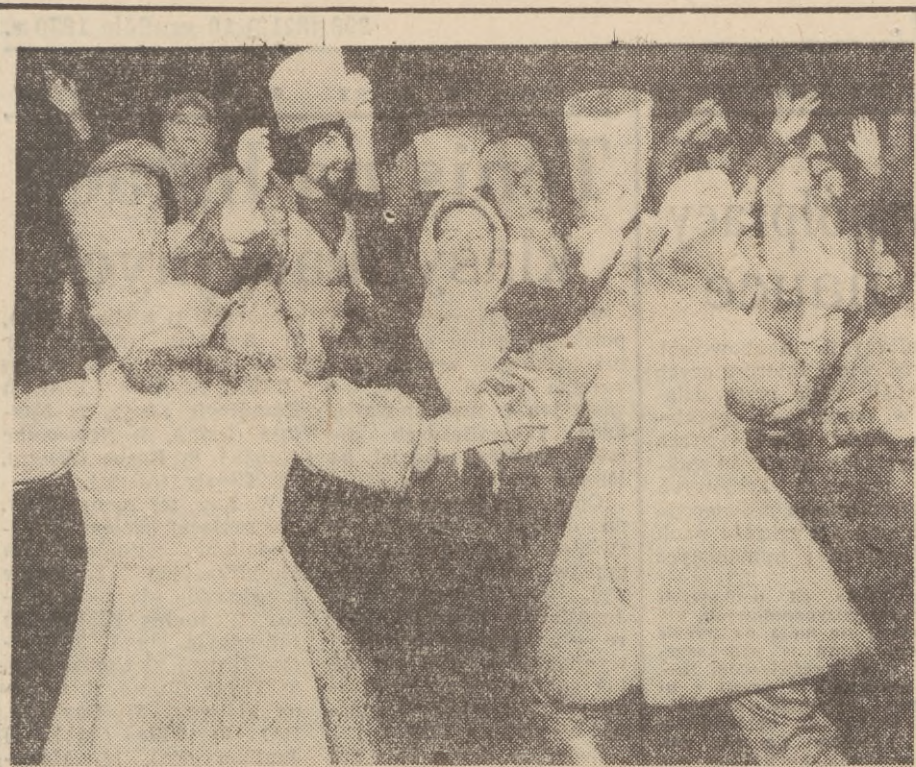
Dziś Państwowa Opera i Filharmonia Bałtycka obchodzi swe 25-lecie. Z okazji srebrnego jubileuszu tej zasłużonej dla rozwoju kultury na Wybrzeżu placówki — jej zespołowi składamy serdeczne gratulacje oraz życzenia dalszej owocnej działalności w służbie naszej kultury. Na zdjęciu: scena zbiorowa z opery „Borys Godunow”, wystawionej przez POIFB. Fot. Wł. Nieżywiński