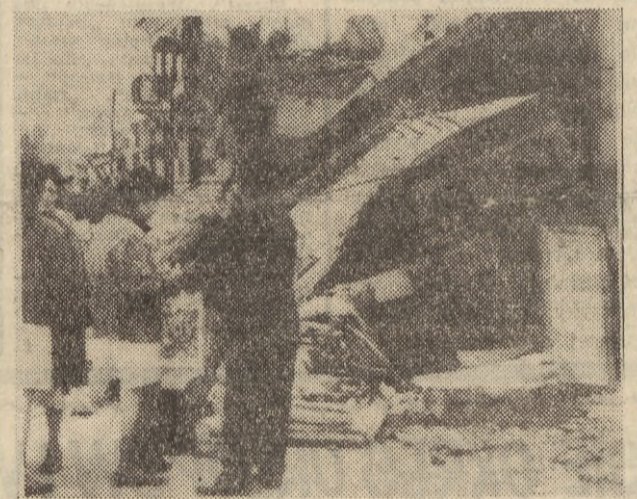
Na terenach dotkniętych trzęsieniem ziemi trwa akcja ratunkowa. Spod zwaliwów gruzu i ziemi wydobywane są zwłoki ofiar. Według ostatnich doniesień liczba zabitych przekroczyła 50 tysięcy. Na zdjęciu: ruiny domów w mieście Chimbote. CAF — AP — telefono

KAIR (PAP). Rzecznik wojskowy ZRA, poinformował, że we środę o godz. 18 około 20 samolotów izraelskich zaatakowało pozycje egipskie w północnym sektorze Kanału Sueskiego. Doszło do bitwy powietrznej z myśliwcami egipskimi. Dwa samoloty izraelskie zostały zestrzelone, a jeden trafiony. Jednocześnie zestrzelony został jeden samolot egipski, którego pilot wyskoczył na spadochronie.