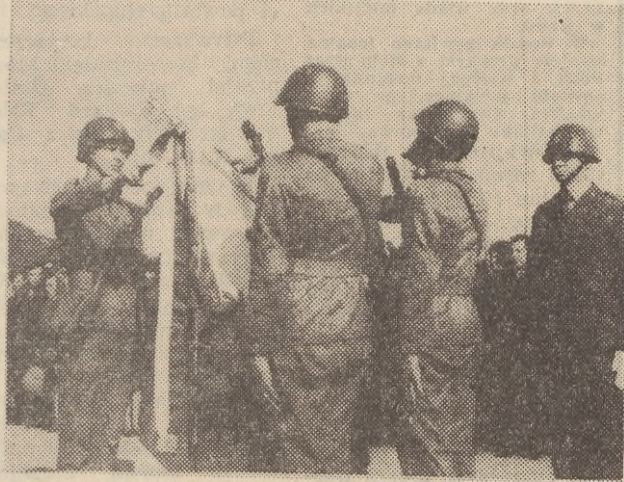
Przysięga junaków OHP na Westerplatte.