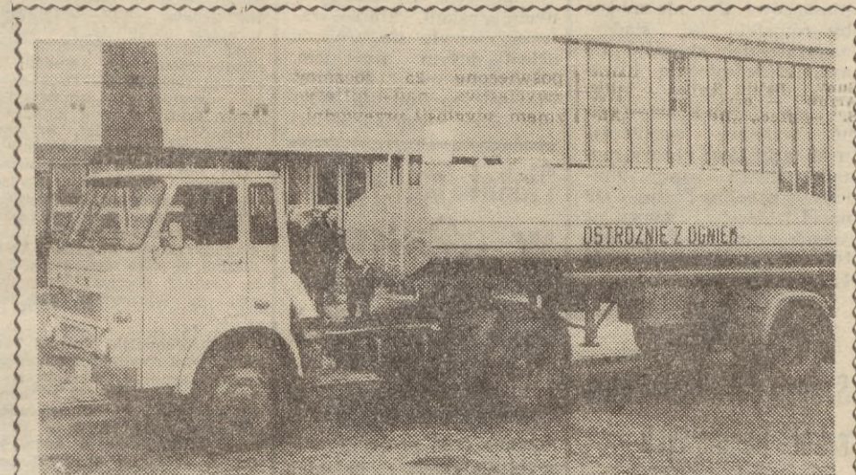
Zaloga Kieleckich Zakładów Metalowych w czynie pierwszomajowym wykonała prototypy samochodów specjalistycznych, przygotowując się tym samym do podjęcia nowej produkcji w ramach przyszłej specjalizacji zakładów. Na podkreślenie zasługuje rekordowy czas w jakim wykonano te prototypy (4 miesiące od projektu do prototypu). Pierwszym prototypem jest samochód samowładzający na podwoziu samochodu „Star-28”. Nowa wywrotka charakteryzuje się ładownością 4,5 tony, a więc o 1 tonę więcej od dotychczas stosowanych na tym podwoziu. Drugim prototypem jest autocystrna skonstruowana na samodzielnym podwoziu o objętości zbiorników 9 m sześć. Nowe wywrotki wejdą do produkcji w IV kw. br. Uruchomienie seryjnej produkcji autocystrny nowego typu planuje się w roku przyszłym. Będą to samochody zbiornikowe specjalistyczne, poszukiwane na wielu rynkach zagranicznych. Na zdjęciu: prototyp cysterny.

Nie ustają poszukiwania idealnego autobusu, który łączyłby wymagania stawiane przez rosnące zatłoczenie ulic i zwiększający się ruch pasażerski z niskimi kosztami eksploatacji. Fabryka Baimler-Benz w NRF zbudowała doświadczalny autobus do przewożenia 66 osób, który posiada napęd spalino-elektryczny. Prąd elektryczny wytwarzany jest przez agregat złożony z silnika wysokoprężnego o mocy 65 KM i prądnicę prądu zmiennego. Podczas jazdy w dzielnicach podmiejskich autobus poruszany jest przez silnik spalinyowy, a pracujący agregat prądowoczą zasila jeszcze dodatkowo akumulatory. W centrum miasta, gdzie przedkłada się jazdy jest niewielki, autobus napędzany jest przez silnik elektryczny czerpiący energię z akumulatorów. Łączny ciężar akumulatorów jest bardzo duży, przekracza 3,5 tony. Autobus może rozwijać szybkość do 70 na godzinę.