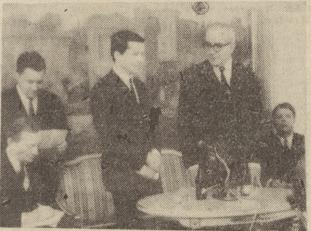
12 bm. w Warszawie, w ostatnim dniu pobytu w naszym kraju, minister Janos Peter spotkał się z dziennikarzami na konferencji, w czasie której odpowiadał na zadawane pytania.

Na zdjęciu: min. J. Peter (z prawej), w czasie konferencji.