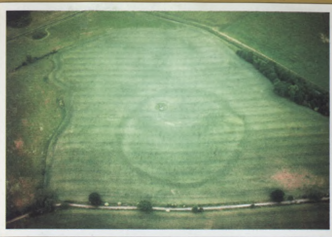
Schwerinsburg, wały obronne słowiańskiej warowni

Jako platforma obserwacyjna służy lekki samolot typu Cessna C172N, w którym przy znacznym nakładzie kosztów obniżono poziom hałasu – jest to konieczny warunek przy lotach w pobliżu stref wrażliwych na hałas. Pomocą przy nawigacji są barwne elektroniczne mapy i urządzenie do nawigacji satelitarnej (GPS), zapisujące również współrzędne nowych znalezisk. Poszukiwania prowadzone z powietrza, obok obchodu terenu, uważane są za najefektywniejszą metodę poszukiwań na większą skalę. Dzięki nim odkrywa się i dokumentuje ślady i zabytki archeologiczne na naszych szerokościach geograficznych. Obchód terenu wymaga co prawda większego nakładu czasu, jest jednak metodą niezastąpioną. Obchodów dokonują w naszym regionie tradycyjnie społeczni członkowie Towarzystwa Archeologicznego Meklemburgii i Pomorza Przedniego. Widok na powierzchnię ziemi zastraszają różne przeszkody – obszary zabudowane, o zamkniętej nawierzchni, np. szosy.