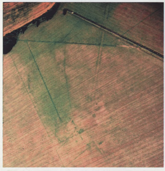
Ślady osadnictwa koło Wendisch-Priborn