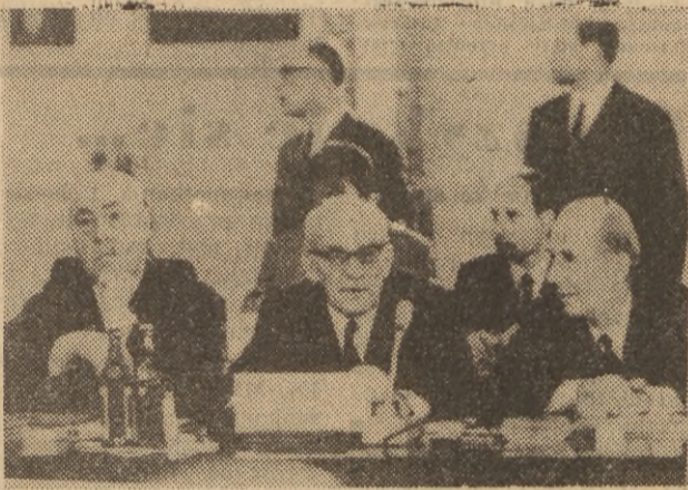
Józef Cyrankiewicz, Władysław Gomułka i Zenon Kliszko w Sali Georgijewskiej na Kremlu.