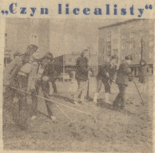
Wkrótce staną do egzaminów maturalnych, dziś wykonują podjęte zobowiązanie: porządkują zielone na pl. Komorowskiego. Na zdjęciu w trakcie prac porządkowych uczniowie XI klasy II Liceum w Gdańsku.