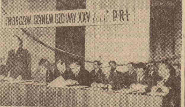
Przetargi i licytacje