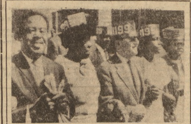
Już ponad miesiąc trwa w Charleston (pid. Karolina) strajk 600 robotników murzynskich, którzy żądają przywrócenia im praw związkowych i zapewnienia normalnych warunków pracy. 22 bm. strajkujący zorganizowali marsz protestacyjny z udziałem przywódcy murzynskiego Ralpha Abernathy'ego (pierwszy z lewej).

MOSKWA (PAP). W związku z 25-leciem Polski Ludowej w dniach od 23 kwietnia do 10 maja odbędzie się w Związku Radzieckim festiwal muzyki polskiej.