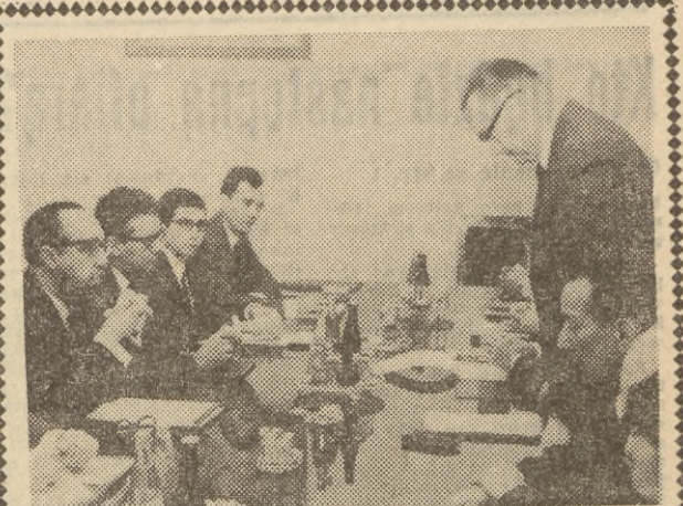
W Urzędzie Rady Ministrów w Warszawie toczyły się rozmowy kubańsko-polskie. W efekcie podpisano umowę o współpracy gospodarczej, naukowej i technicznej. Na zdjęciu: w czasie rozmów. Pierwszy od lewej — Carlos Rafael Rodriguez, przewodniczący delegacji kubańskiej, drugi od prawej — Piotr Jaroszewicz

W dniu dzisiejszym przybyła na Wybrzeże delegacja Kuby z sekretarzem KC Komunistycznej Partii Kuby Carlosem Rafaelem Rodriguezem. Podczas pobytu w trójmieście goście kubańscy zwiedzą niektóre zakłady pracy, gdańską Starówkę oraz Westerplatte.