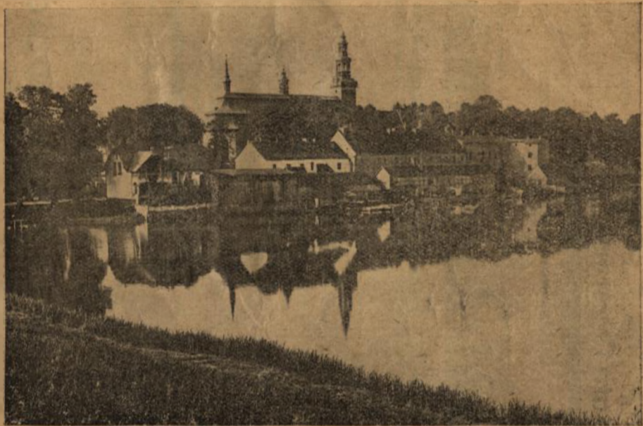
KOŚCIÓŁ POKLASZTORNY W KARTUZACH