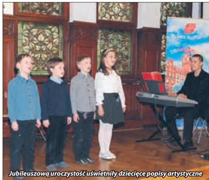
Jubileuszową uroczystość uświetniły dziecięce popisy artystyczne