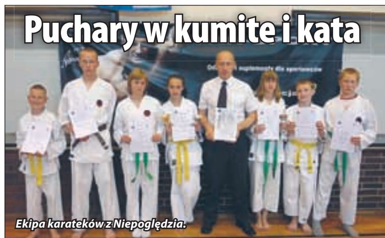
Ekipa karateków z Niepogłędzia.