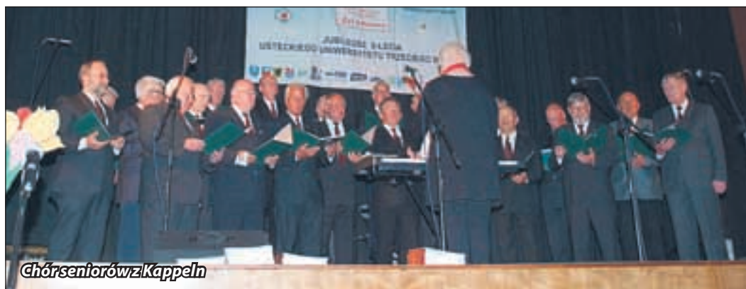
Chór seniorów z Kappeln