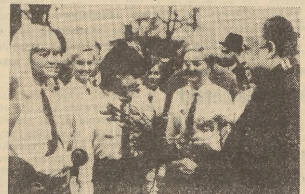
Na zdjęciu: załoga Wytwórni Sprzętu Komunikacyjnego we Wrocławiu wita przewodniczącego Rady Państwa Mariana Spychalskiego.

Marian Spychalski spotkał się z członkami Egzekutywy KW PZPR we Wrocławiu.