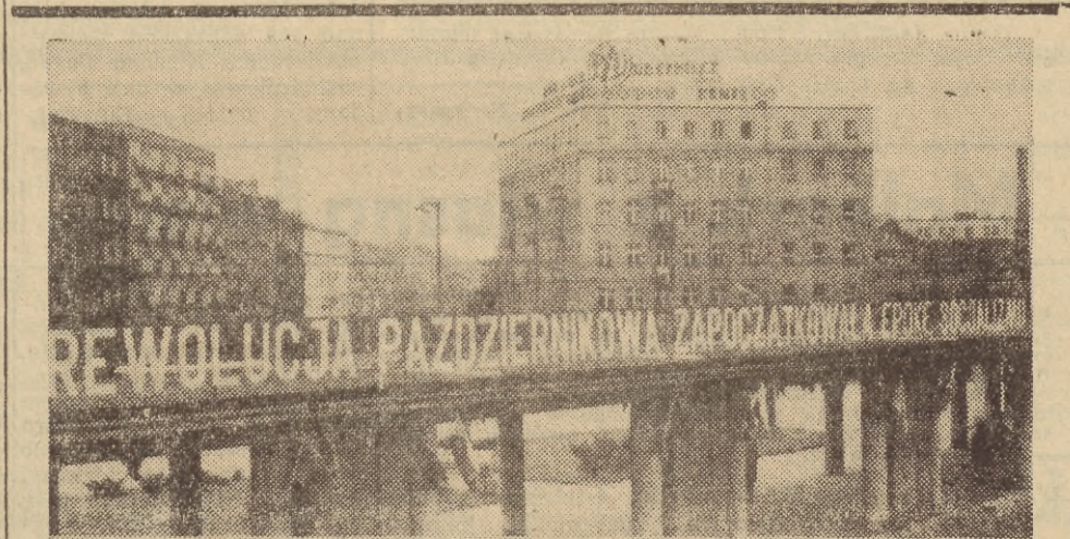
Dekoracja Gdyni z okazji 50 rocznicy Wielkiego Października.

...dwie nowe ulice otrzymały już nazwy. Ulica nr 452 (równoległa do ul. Rolniczej) nazywać się obecnie Konwaliowa, a ul. 1027 (równoległa do Malorkackiej) — Narcyzowa.