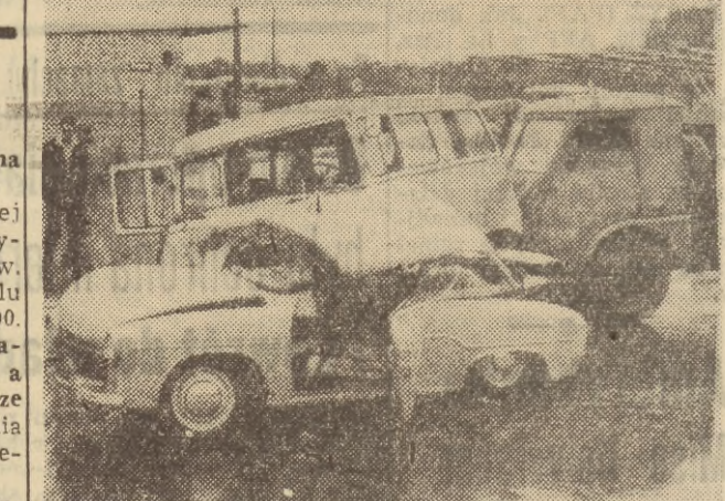
17 bm. na ul. Grójeckiej w Warszawie wydarzył się tragiczny wypadek. Samochód „Sirena“ wpadł w poślizg i zderzył się z furgonetką „Nysa“...