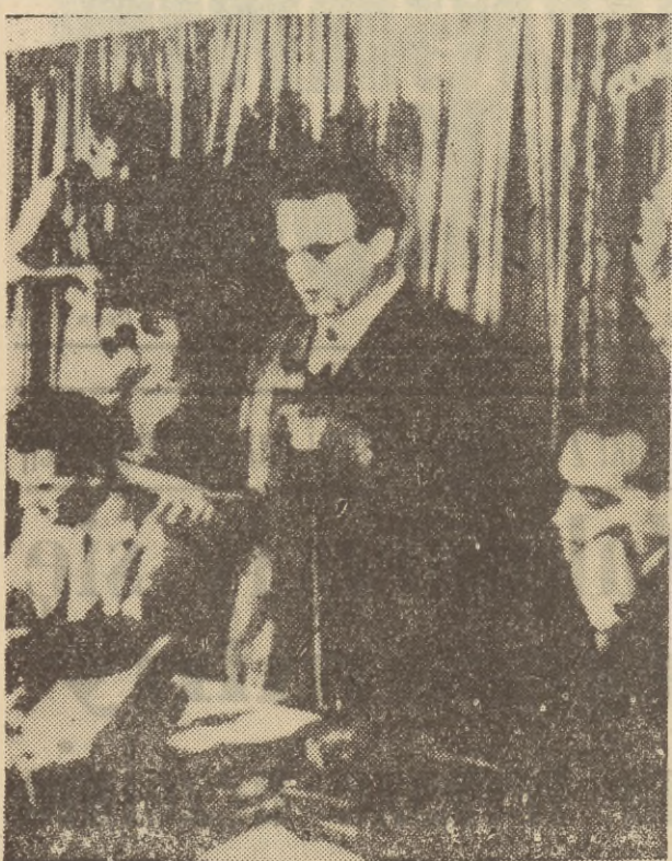
16 bm. mieszkańcy Marzabotto (Włochy) u... w sprawie ewentualnego ułaskawienia...