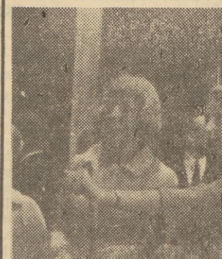
Premier Francji G. Pompidou przebywał 5 dni w Leningradzie. Wraz z nim do Leningradu przybył także minister spraw zagranicznych Francji Couve de Murville oraz inne francuskie osobistości oficjalne. Na zdjęciu: G. Pompidou wraz z żoną (z lewej) z wicedyrektorem CAF

MOSKWA (PAP). Premier Francji, Georges Pompidou, opuścił wczoraj Leningrad, udając się do Moskwy. Wraz z nim odjechał do stolicy ZSRR wicepremier Władimir Kirillin, który towarzyszy mu w podróży. W Leningradzie i jego okolicach Georges Pompidou zapoznał się ze zwartkami muzeami oraz zabytkami historycznymi i architektonicznymi. Rada miejska wydała na cześć premiera Francji przyjęcie. Premier Pompidou przebywa w Związku Radzieckim z wizytą oficjalną.