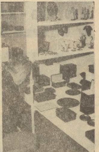
W galerii sztuki na MDM-ie otwarta została 5 bm. I ogólnopolska wystawa pamiętkarstwa, zorganizowana przez „Cepelię”. 113 producentów prezentuje ok. 4 tys. wzorów pamiętek z wielu regionów kraju, sporządzonych z różnych surowców. Ekspozycja jest zarazem przeglądem dotychczasowych osiągnięć w zakresie rozwoju pamiętkarstwa w Polsce. Wystawa czynna będzie do 25 bm.

Na zdjęciu: na wystawie.