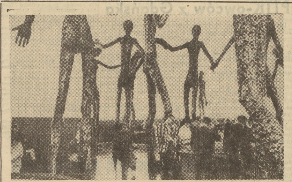
Przed pawilonem brytyjskim przyciąga uwagę imponująca rzeźba grupowa zatytułowana „Symbol na dzień na świat bez wojen”.