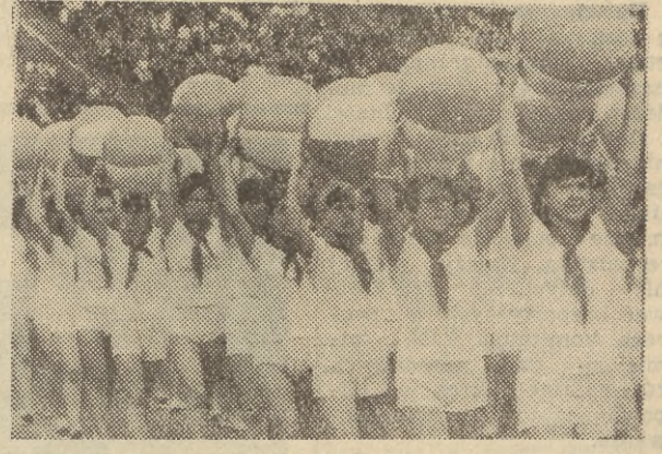
Dzień Dziecka na Stadionie Dziesięciolecia w Warszawie. W imprezie brało udział ponad 70 tys. młodych widzów.