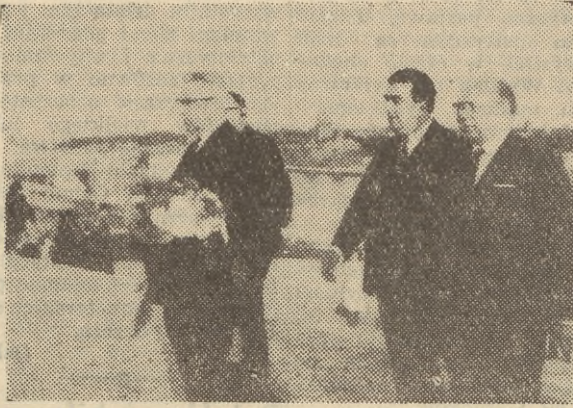
Przewodniczący Rady Państwa Edward Ochab składa wiązankę kwiatów pod pomnikiem Bohaterów Westerplatte 1939 — 1945.

wojewódzkiej Rady Narodowej poświęcona podsumowaniu obchodów Tysiącle-