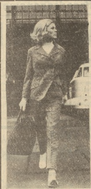
Najlepszy strój podróżny, wyliczkowy, a w ogóle na chłodniejsze dni lata — to damska wersja męskiego garnituru. Najmłodniejsze są z materiałów w stosowane krótki, pepitkę lub w przalki. Na zdjęciu: modelka prezentuje jeden z garniturów wyprodukowanych przez NRD-owski przemysł odzieżowy.

— Popatrzcie, to ja budowałem tę fabrykę! Byłem wtedy w mundurze... Por. rez. Lech NIEKRASZ