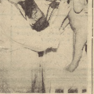
W tym dniu (1950 r.) żłobek przeniesiono do budynku przy ul. Wassowskiego 7 we Wrzeszczu po zlikwidowanej sto-

kówce akademickiej. W tej chwili uczęszcza doń 66 małych, a w tej liczbie 43 dzieci pracowników Politechniki Gdańskiej, którzy nadal korzystają z praw pierwszeństwa, mimo że administracyjnie żłobek podlega Wydziałowi Zdrowia Prezydium MRN. Kierownictwo