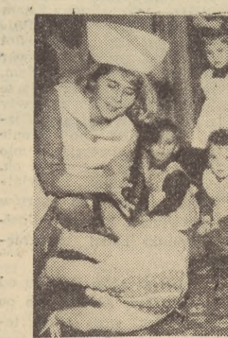
matek, pracujących przy odbudowie i organizacji tej największej obecnie uczelni trójmiasta. Życie dyktowało konieczność zorganizowania schronienia dzieciom, które często z braku opieki w domu oczekiwały na powrót swoich matek na dziedzińcu politechniki. Ustawia no wszystkie wózki obok siebie, a matki na zmianę czuwały i zabawiały pociechy. Dziś wydają się to nieprawdopodobne, a jednak tak było.

Żłobek Politechniki Gdańskiej urządzono w maju 1946 roku w domu mieszkalnym przy ul. Wróblewskiego 3. Na potrzeby żłob-