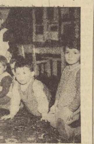
W tym dniu (1950 r.) żłobek przeniesiono do budynku przy ul. Wassowskiego 7 we Wrzeszczu po zlikwidowanej sto-

W 1950 r. żłobek przeniesiono do budynku przy ul. Wassowskiego 7 we Wrzeszczu po zlikwidowanej sto-