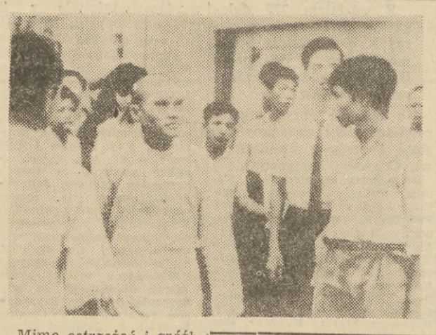
Mimo ostrzeżeń i gróźb jakie zawarte były w przemówieniu radiowym wygłoszonym w niedzielę przez premiera rządu południowowietnamskiego Nguyen Cao Ky, w Wietnamie południowym nie ustają demonstracje protestu przeciwko reżimowi generałów.

Z niektórych województw korespondenci PAP informują o podjętych już zobowiązaniach. Z relacji tych wynika, że zakłady szeregu zakładów poświęciły wiele uwagi produkcji eksportowej.