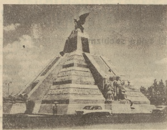
Pomnik Ras w mieście Meksyk — znajduje się na trasie wylotowej z miasta. Pomnik będzie miejscem centralnym Wioski Olimpijskiej podczas XIX Igrzysk w 1968 roku. Głównym elementem pomnika jest motyw herbu meksykańskiego: orzeł pożerający węża, umieszczony na cokole w kształcie piramidy azteckiej.