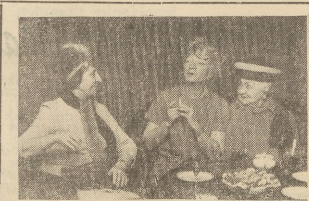
Sławna w Polsce międzywojennej aktorka Maria Modzelewska, która nie mieszka obecnie w kraju, bawiła się w Warszawie. W dniu 23. II. 1966 r. spotkała się ona z aktorami scen warszawskich. W spotkaniu tym uczestniczyli znani aktorzy.