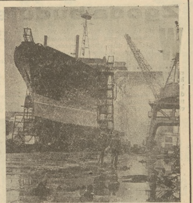
Stocznia w mieście Mikołajew w Związku Radzieckim już trzeci raz otrzymała w ramach ogólnopanstwowego współzawodnictwa pracy propozycję Rady Ministrów ZSRR i Wzręczniackowej Rady Związków Zawodowych oraz wysoką premię pieniężną. Stocznia jest wyspecjalizowaną placówką budującą trawery dla floty rybackiej ZSRR.

Na zdjęciu: trawler rybacki — dzieło stoczniowców z Mikołajewa; budowę ukończono przedterminowo na cześć zbliżającego się Zjazdu KPZR.