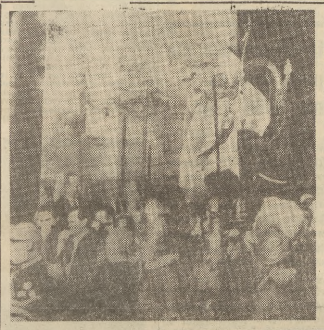
Na zdjęciu: papież Paweł VI niesiony na tronie — lektyce pozdrawia tłumy zebrane na placu św. Piotra.

Odczytano również orędzie papieża do rządów, inteligencji, artystów, kobiet, do ludzi pracy, do biednych i chorych i do młodzieży.