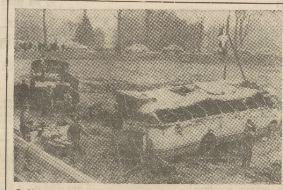
Rozbity autobus w tragicznej katastrofie pod Skwierzyną.

ZIELONA GÓRA (PAP). 27 bm. rano korespondent PAP w Zielonej Górze połączył się telefonicznie ze szpitalami w Zielonej Górze, Gorzowie, Skwierzynie i Międzyrzeczu, gdzie przebywa na leczeniu 29 osób — ofiar katastrofy autobusowej pod Skwierzyną.