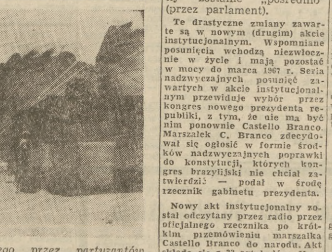
Zaopatrywanie otoczonego przez partyzantów obozu wojsk rządowych pod Plei Me. Na zdjęciu: zasobniki z żywnością i amunicją wrzucane na spadochronach do obozu u Plei Me.

ZIELONA GÓRA (PAP). 27 bm. rano korespondent PAP w Zielonej Górze połączył się telefonicznie ze szpitalami w Zielonej Górze, Gorzowie, Skwierzynie i Międzyrzeczu, gdzie przebywa na leczeniu 29 osób — ofiar katastrofy autobusowej pod Skwierzyną.