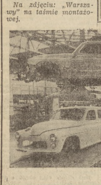
CAF - Czarnogórski

Na zdjęciu: „Warszawy” na taśmie montażowej.