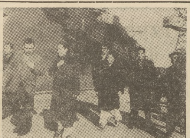
Wczoraj bawiła na Wybrzeżu 7-osobowa grupa związkowców z Wietnamu przebywająca od kilku dni w Polsce z okazji VI Kongresu SFZZ w Warszawie. Goście zwiedzili trójmiasto oraz uczestniczyli w wiecu zorganizowanym w Stoczni Gdańskiej. Na wiecu zdecydowanie potępiono agresję amerykańską w Wietnamie. Na zdjęciu: goście podczas zwiedzania Stoczni Gdańskiej.

Program pobytu delegacji brytyjskiej przewiduje zwiedzenie ośrodków rybołówstwa morską w Szczecinie, Swinoujściu i Gdyni oraz Krakowa.