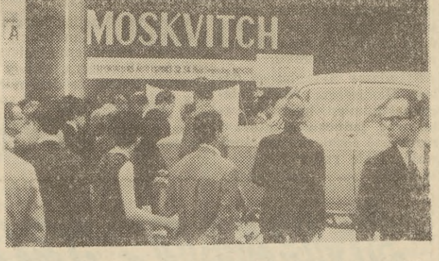
Na zdjęciu: najnowszy model „Moskwicza 1300” w radzieckim pawilonie wystawy.

Wspaniałych samocho- dów, pod pozorem błęgiego spokoju i eleganckiego man- ierem na paryskim salonie, to czy się jednak brutalna i bez pardonowa walka.