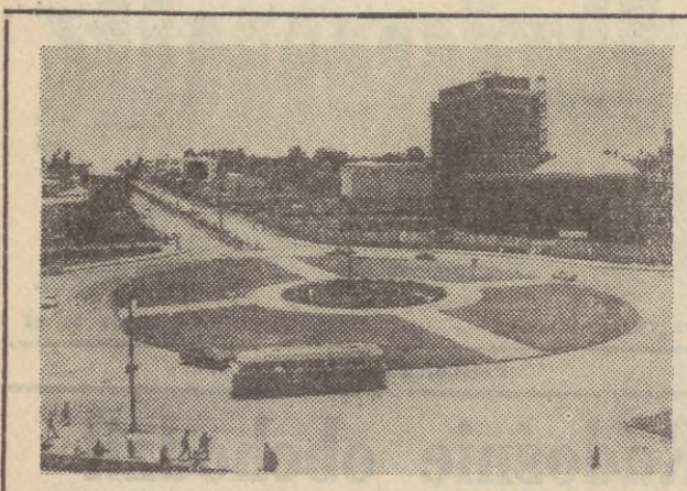
23 lipca — Święto Narodowe Abisynii. Jeszcze do niedawna Polska była lepiej znana w Abisynii, niż Abisynia w Polsce. Po niedawnej wizycie oficjalnej w naszym kraju (jesienią ub. r.) cesarza Abisynii Haile Selassiego wzrosła nie tylko wiedza o tym wschodnioafrykańskim kraju, lecz nawiązano także szersze kontakty handlowe i gospodarcze. Na zdjęciu: Addis Abeba — nowoczesna dzielnica wokół wielkiego ronda w centrum stolicy Abisynii.

Angielski długodystansowiec Ron Hill ustanowił w środę dwa nowe rekordy świata. Przebiegł on 25 km. w 1:15,22,6 h i 400 m. w 1:15,22,6 h. Bieg „po drodze” także rekord na 15 mil rezultat 1:12,48,2. Poprzednie rekordy świata na tych dystansach należały do sławnego biegacza czechosłowackiego Emila Zatopki (1:16,36,4 i 1:14,01,0). Zostały one ustanowione 29 października 1955 r. Były to ostatnie wyniki Zatopki figurujące aktualnie w tabeli rekordów świata.