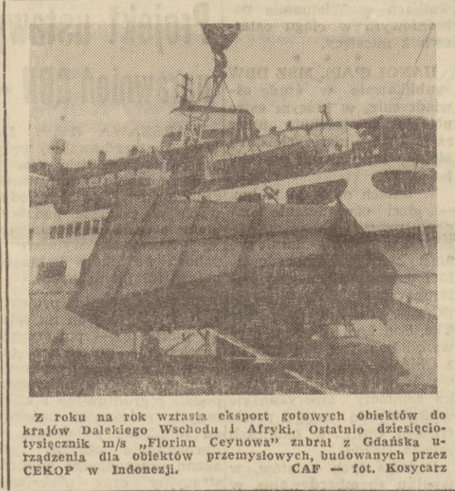
Z roku na rok wzrasta eksport gotowych obiektów do krajów Dalekiego Wschodu i Afryki. Ostatnio dziesięcioletni kontrakt m/s „Florian Ceynowa” zabrał z Gdańska urzędzenia dla obiektów przemysłowych, budowanych przez CEKOP w Indonezji.

wego, podatku od nieruchomości i opłaty elektryfikacyjnej ze szczebla powiatowego na szczebel gromadzki, przy równoczesnym wprowadzeniu nowej techniki wymiarowo-rachunkowej. Uzasadnienie zostało również przedstawione. Projekt zakłada, że ustawa stosuje się od roku podatkowego 1966.