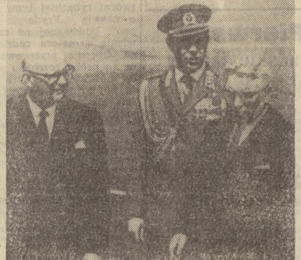
Edward Ochab, przewodniczący Rady Państwa PRL, przybył w czwartek do oficjalnej siedmiodniowej wizyty do Finlandii. Na zdjęciu: prezydent Finlandii Urho Kekkonen (z lewej) oraz Edward Ochab na lotnisku w Helsinkach.