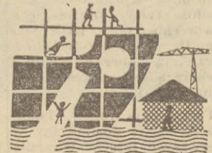
łącznej nośności 1.627 tys. ton. 75 proc. produkcji

W przyszłej 5-letniej stoczni Wybrzeża Gdańskiego zbudują statki o