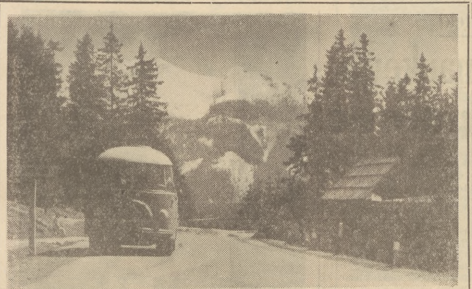
Przepiękne tereny na Głodówce koło Bukowiny Tatrzańskiej. Tędy przebiegać będzie 16 maja br. etap kolarskiego Wyścigu Pokoju z Tatrzańskiej Łomnicy przez punkt graniczny na Łysej Polanie do Bielska Białej.