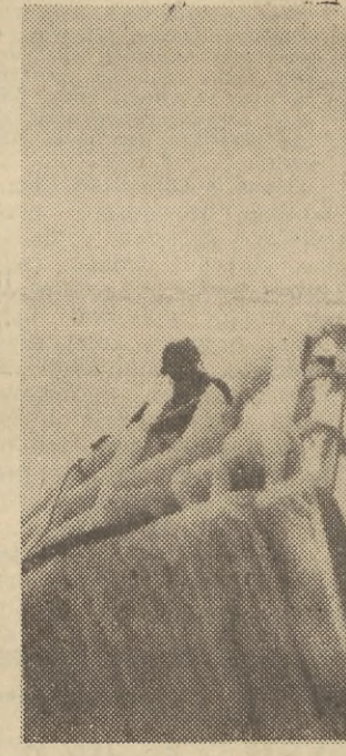
Tak wyglądają statki powracające do Gdyni.

nych. Czynne były wczoraj (situacja zmienia się nieustannie). • Dokończenie na str. 2