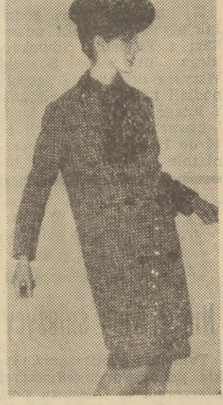
Sukienka i płaszcz o długości 7/8 z tweedu białogranatowego. Zapięcie dwurzędowe. Zamiast kołnierza — sztyfona apaszka. Model z kolekcji paryskiej domu mody Jeanne Lanvin.