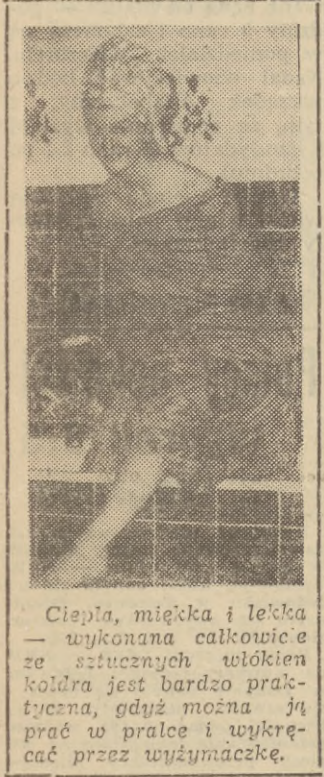
Ciepła, miękka i lekka — wykonana całkowicie ze sztucznych włókien koldra jest bardzo praktyczna, gdyż można ją prać w pralce i wykręcać przez wyciąmaczkę.

ZARZĄD PORTU GDYNIA wzywa do pracy całą rezerwę robotników portowych grup A, B, C i E od czwartku, dnia 1 marca 1965 r. godz. 7 do soboty, dnia 6 marca 1965 r. godz. 15 włącznie oraz niedzielę, dnia 7 marca 1965 r. godz. 23 do wtorku, dnia 9 marca 1965 r. godz. 15 włącznie.