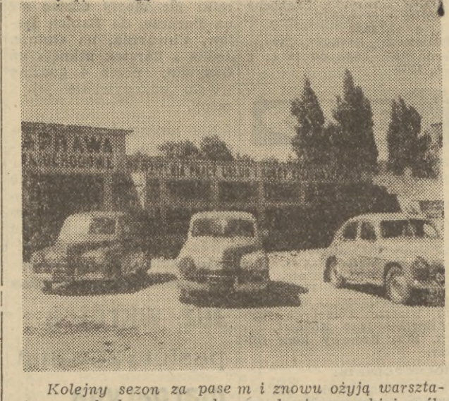
Kolejny sezon za pasem i znowu ożyją warsztaty samochodowe — oczko w głowie sopockiej spółdzielni emerytów...

POLSKA jest jednym bo daj wśród krajów demokracji ludowej państwem, które zastosowało wobec emerytów 500-złotowa bariera dodatkowego zarobku. Skoro więc nie ma jeszcze w tej chwili szans — ze względów ekonomicznych — na wyrównanie w skali krajowej emerytur i rent do poziomu dostatecznej na stare lata egzystencji, to dajmy tym ludziom możliwość legalnego zarobku w przyzwolonych i rozsądnych granicach np. w spółdzielczości usługowej. Ludzie ci zarobka na pewno swoją pracą na siebie i na podatki. Ale trzeba ku temu stworzyć odpowiedni klimat.