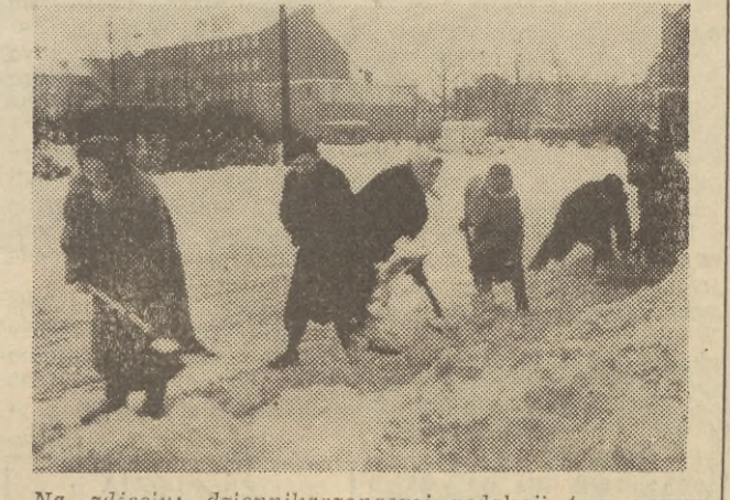
Na zdjęciu: dziennikarze naszej redakcji tym razem przy łopatach.

Nie wolno czekać z założonymi rękami, aż śnieg zasypie nasze ulice i podwórka, nie możemy liczyć jedynie na pracę służby powołanej do utrzymania porządku w mieście. Społeczeństwo woj. gdańskiego znane jest ze swej ofiarności i dlatego jesteśmy pewni, że na-