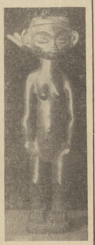
„Sztuka ludowa narodu światła” — to tytuł wystawy otwartej w Muzeum Etnograficznym w Toruniu. Ekspozycja obejmuje około 300 eksponatów jak rzeźba, wyroby ceramiczne, ozdoby oraz broń, instrumenty muzyczne i przedmioty codziennego użytku. Wszystkie wystawione przedmioty nadesłali zbieracze z kraju i zza granicy (między innymi Polacy zamieszkałi na obczyźnie), a także pracownicy polskich placówek dyplomatycznych — w odpowiedzi na apel Rady Uczelnianej ZSP i Klubu Studenckiego „Od nowa” przy Uniwersytecie Mikołaja Kopernika. Właścicielem najbardziej interesujących eksponatów przyznano nagrody. Ciekawą wystawą zorganizowaną została przy współpracy Muzeum Etnograficznego oraz prof. dr Marii Znamierowskiej-Prufferowej.

Na zdjęciu: figurka dziecinny z Kabwe (Kongo).