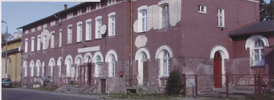
Budynek dworca sprzed lat i obecnie... Aktualnie obiekt jest we władaniu kilku podmiotów gospodarczych.