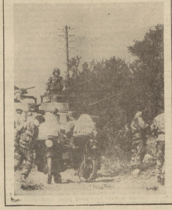
Organizacje terrorystyczne rekrutujące się do mniejszości o niemieckim języku ojczystym prowadzą propagandę za odłączeniem Górnej Adygi od Włoch i organizują zamachy terrorystyczne.

Mimo groźnej sytuacji i zmagań z piorzącymi się wysoko falami, jednostki rybackie sprawnie i w porządku popłynęły do portów. Tutaj, przez cały dzień stały w pogotowiu statki ratownicze. (sta)