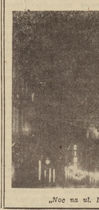
„Noc na ul. Długiej” fot. Adam Chmielewski — Gdańsk