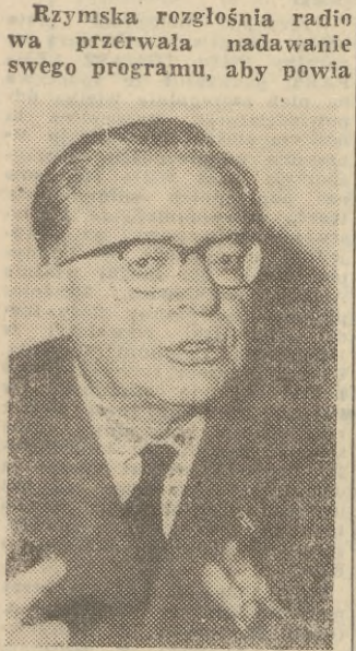
Rzymska rozgłośnia radio, w przerwa nadawanie swego programu, aby powia

RZYM (PAP). Sekretariat Włoskiej Partii Komunistycznej zakomunikował z głębokim żalem, że generalny sekretarz partii PALMIRO TOGLIATTI zmarł w piątek o godzinie 13.20 w Jalcie.