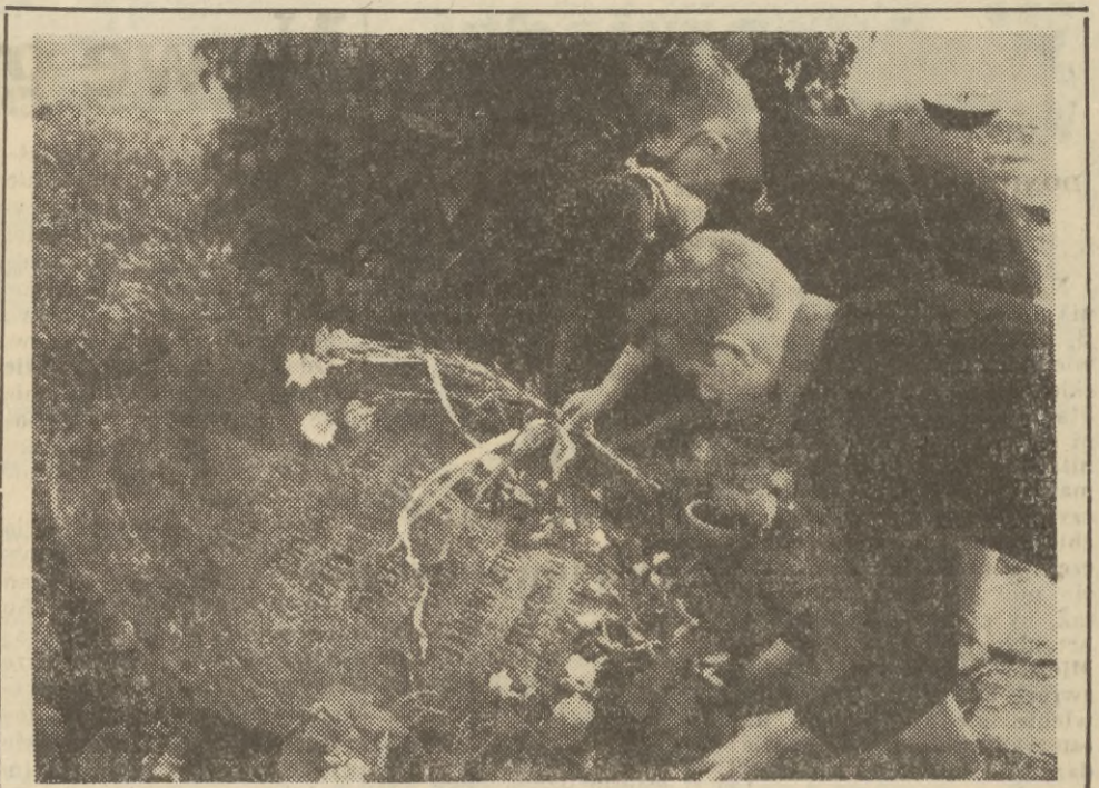
5 sierpnia 1864 r. na stokach Cytadeli Warszawskiej stracono Romualda Traugutta wraz z Krajewskim, Toczyńskim, Żulińskim i Jeziorańskim — członków ostatniego Rządu Narodowego. Powstanie przeciwko caratowi nie wygasło i zbrojne walki trwały jeszcze do późnej jesieni. W 100 rocznicę na miejscu straceń złożono symboliczne kwiaty.