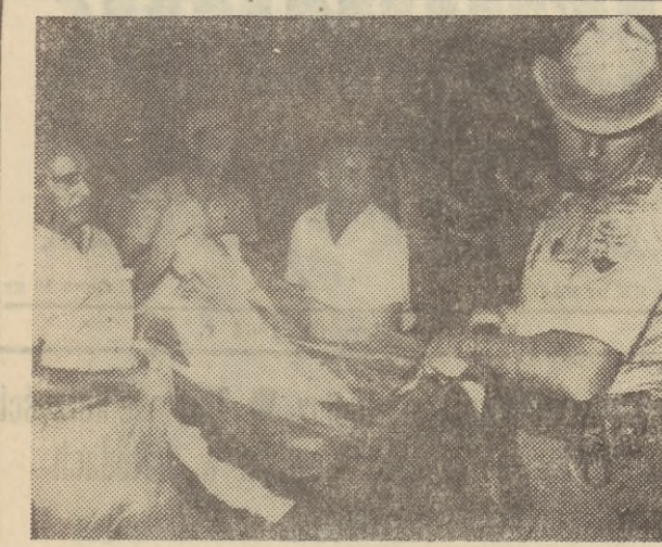
W nocy z wtorku na środę (4 — 5. VIII. br.) w pobliżu Philadelphii w stanie Mississippi znaleziono zwłoki trzech młodych amerykańskich pilotów i o integrację rasową w USA.

Ważnym programem rozwoju branż musi być zsynchronizowany z rozwojem regionów gospodarczych, z ogólnymi i wieloletnimi planami produkcyjnymi z zamierzeniami inwestycyjnymi w zakresie postępu technicznego, o działu produkcji, kooperacji itp.