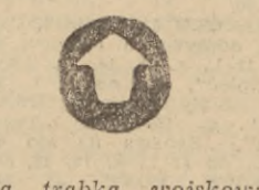
Ta trąbka wojskowa wzywała żołnierzy inwazyjnych wojsk angielskich...