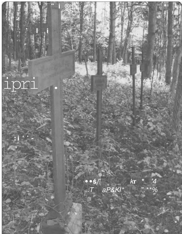
„Zakilkanaście lat las zatrze i teślady starego cmentarjaj