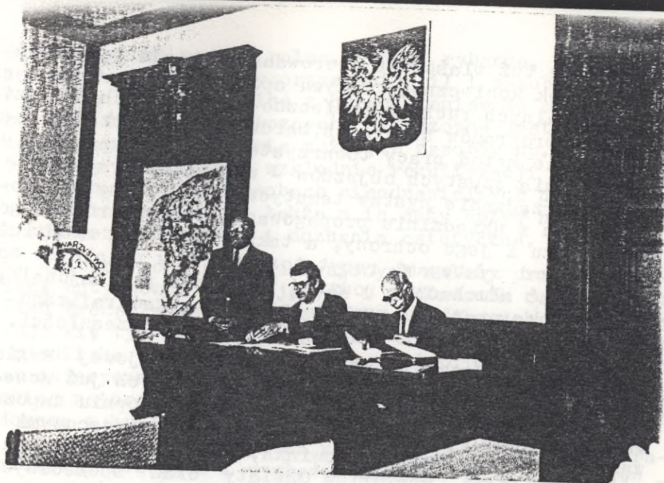
Sala obrad Sesji Referatowo-Dyskusyjnej X Spotkań Regionalnych w Słupsku - - dnia 10 czerwca 1995 r.