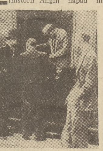
Na zdjęciu: detektywi Scotland Yardu oglądają wagon pociągu pocztowego.

LONDYN. Największy w historii Anglii napad nie