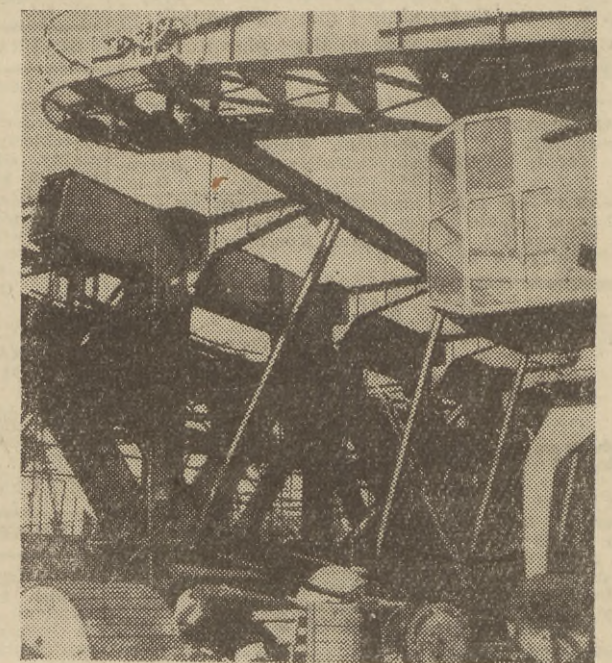
W Stoczni im. Komuny Paryskiej w Gdyni trwają prace przy montażu wielkiej suwnicy rzecznej dla suchego doku.

WARSZAWA. Na zaproszenie polskiej grupy Unii Międzyparlamentarnej do Polski przybyli parlamentarzyści japońscy — Kato Kenju i Shimagami Zengoro. Deputowani japońscy złożyli wizytę w Sejmie.