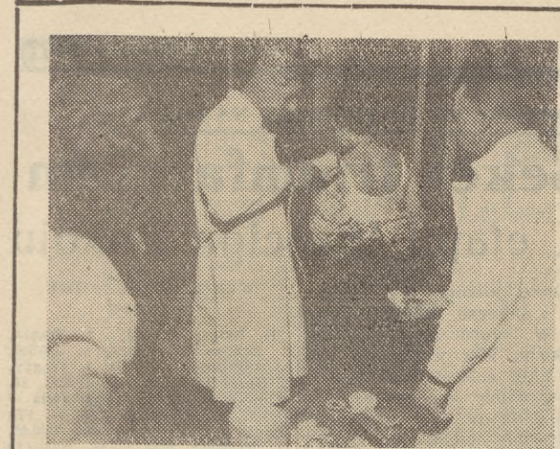
W Sztokholmie zanotowano kilka wypadków ospy, co postawiło w stan pogotowia szwedzką służbę sanitarną. Na zdjęciu: jedna z ekip lekarskich szczepi personel sklepu odwiedzanego przez osoby, które zachorowały na ospę.

Dobre spisał się rybakcy z Przedsiębiorstwa Polowów i Usług Rybackich „Koga”, którzy w dniu wczorajszym wykonali półroczny plan połowów zarówno pod względem ilościowym jak i wartościowym. Tak więc helska „Koga” już od dziś łowi na poczet planu II półrocza. Sukces ten pozwala przypuszczać, że te roczne zadania połowowe rybacy z „Kogi” wykończą z poważną nadwyżką.