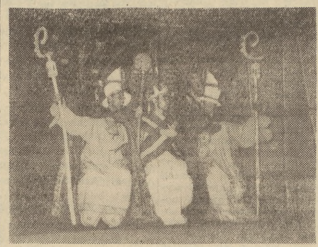
Zdrowcy biskupi.