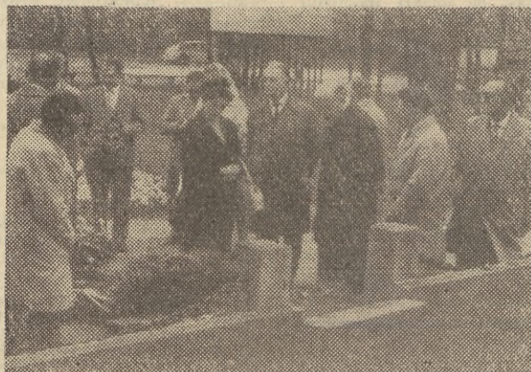
kim Frontu Jedności Narodowej.

KAIR (PAP). Powołując się na „kółko kompetentne”, korespondent AFP podaje, że bawiący w Egipcie przywódca kurdyjski pułkownik Talaban stara się uzyskać poparcie prezydenta Naserza na wypadek wznowienia walk kurdyjsko-irackich.