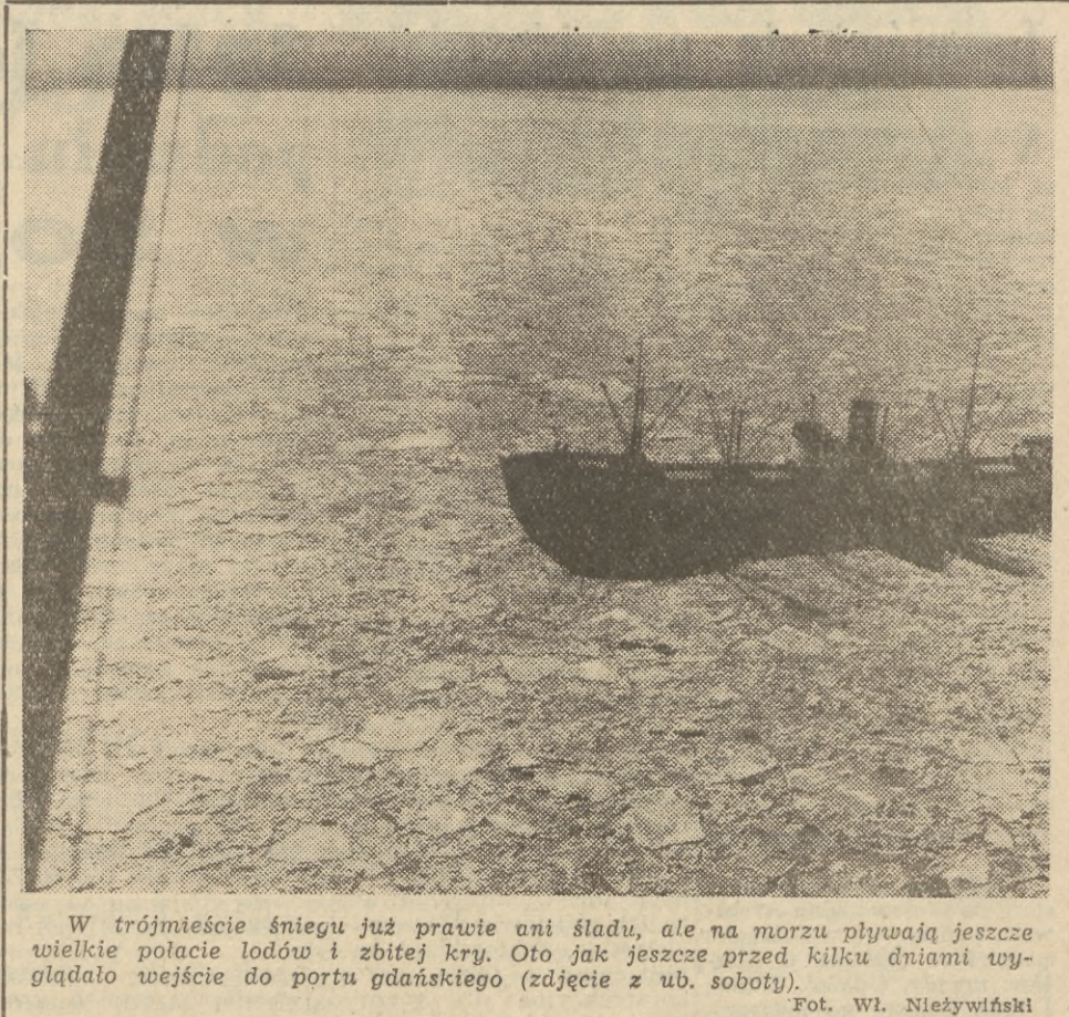
W trójmiesięcie śniegu już prawie ani śladu, ale na morzu pływają jeszcze wielkie polacie lodów i zbitej kry. Oto jak jeszcze przed kilku dniami wyglądało wejście do portu gdańskiego (zdjęcie z ub. soboty).