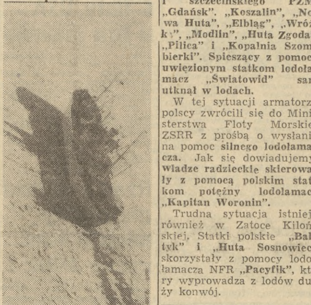
W drodze do Gdańska statki muszą przebiegać przez zwarte pola lodu.

Sytuacja żegluga w Sundzie jest nadal bardzo ciężka. Wschodnie wiatry i statków. W liczbie ich znajdują się również jednostki armatora gdynińskiego PLO i szwedzkiego PZM: „Gdańsk”, „Koszalin”, „Nowa Huta”, „Elbląg”, „Wróżka”, „Modiła”, „Huta Zgoda”, „Pileca” i „Kopalnia Szombierki”. Spieszący z pomocą uwiecznionym statkom lodolamacz „Światowid” sam utknął w lodach.